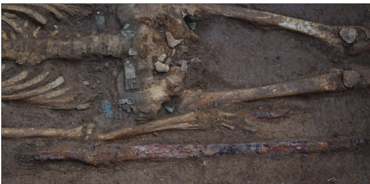
Sl. 12 Detalj groba 42 sa željeznim palašem i brončanom pojasnom garniturom

Fig. 11 Silver lunulus earrings from the graves 29 and 40