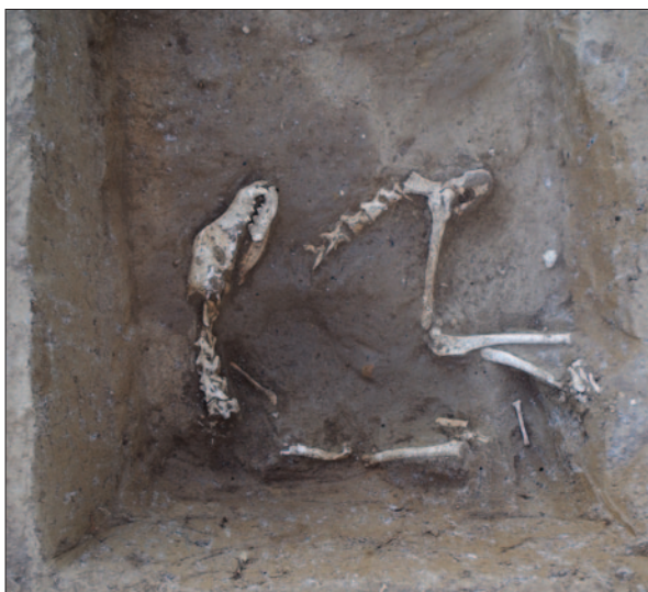
Sl. 8 Detalj groba 21 – ukop psa u zapuni groba