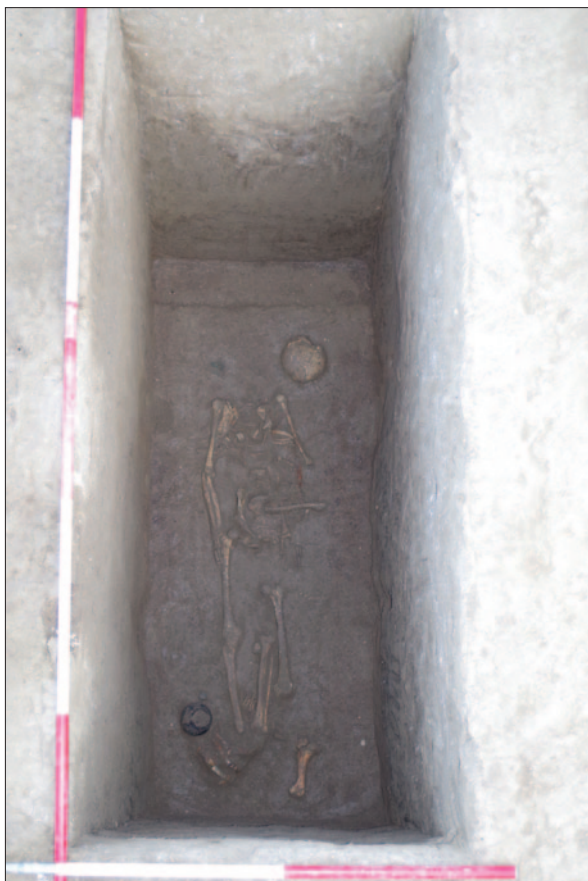
Sl. 3 Grob 40 Fig. 3 Grave 40