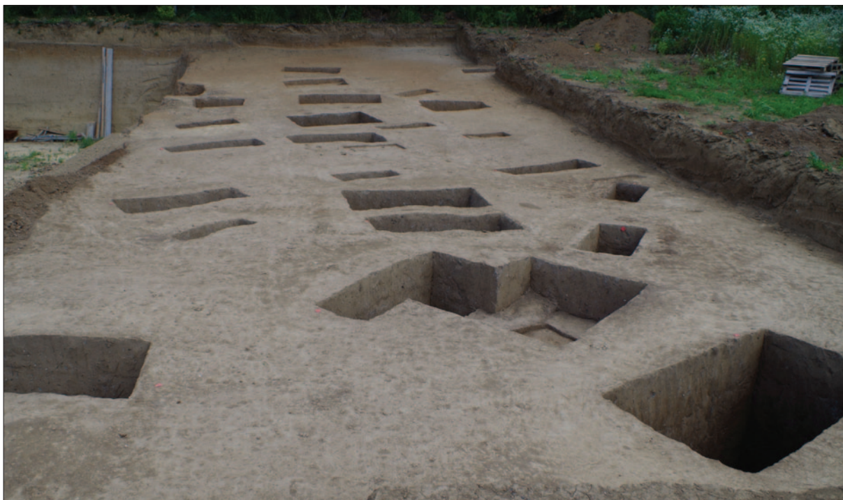
Sl. 2 Pogled na sondu II s redovima grobova

Fig. 1 View at the southern part of the Trench II with filling of the graves