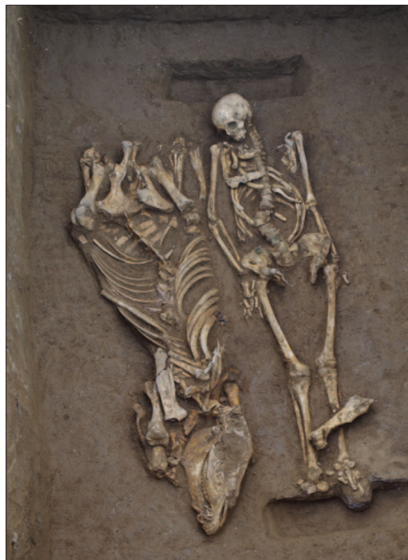
Sl. 4 Grob 25 – ukop konjanika i konja Fig. 4 Grave 25 – a burial of horseman with a horse