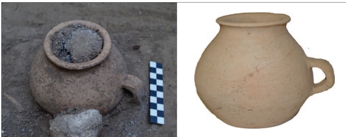
Sl. 7 Detalj groba 16 s keramičkom posudom