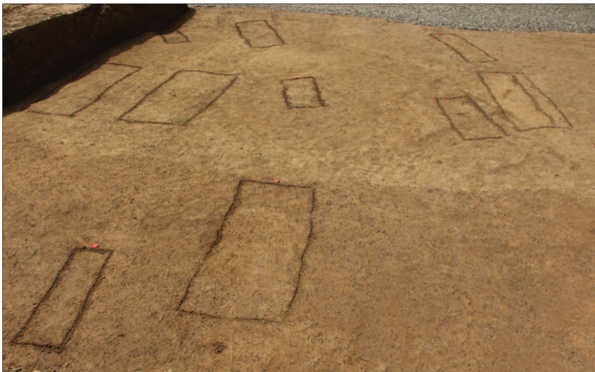
Sl. 1 Pogled na južni dio sonde II sa zapunama grobova

Fig. 1 View at the southern part of the Trench II with filling of the graves