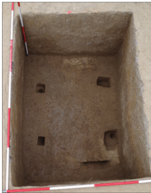
Sl. 6 Dno groba 26 s ostacima drvene grobne arhitekture Fig. 6 Bottom of grave 26 with the remains of a wooden grave architecture