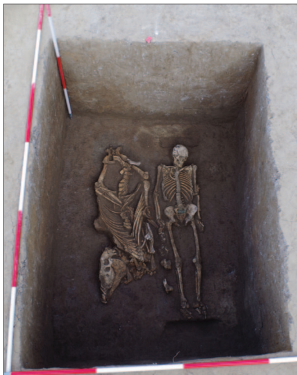
Sl. 5 Grob 26 – ukop konjanika i konja Fig. 5 Grave 26 – a burial of horseman with a horse