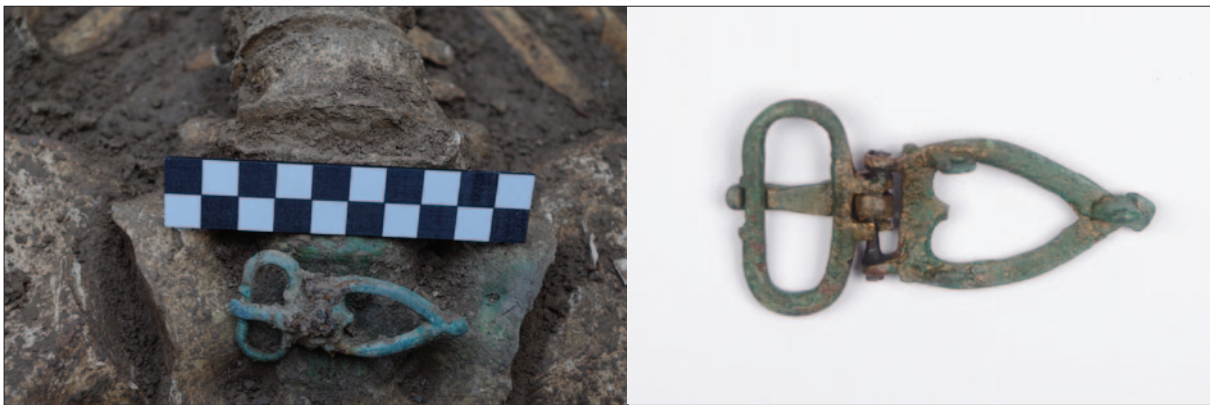
Sl. 10 Detalj groba 26 s brončanom pojasnom kopčom

Fig. 9 Bronze belt fitting from the grave 42