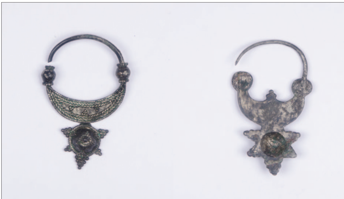
Sl. 11 Srebrne lunulaste naušnice iz grobova 29 i 40

Fig. 11 Silver lunulus earrings from the graves 29 and 40