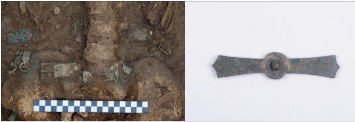
Sl. 9 Brončani pojasni okov iz groba 42

Fig. 9 Bronze belt fitting from the grave 42