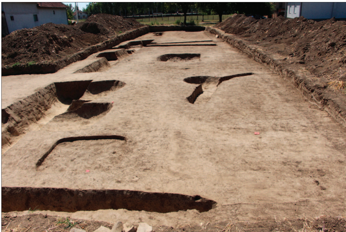
Sl. 1 Istražena sonda 23 – pogled sa sjevera

Fig. 1 Excavated trench 23 – a view from the north