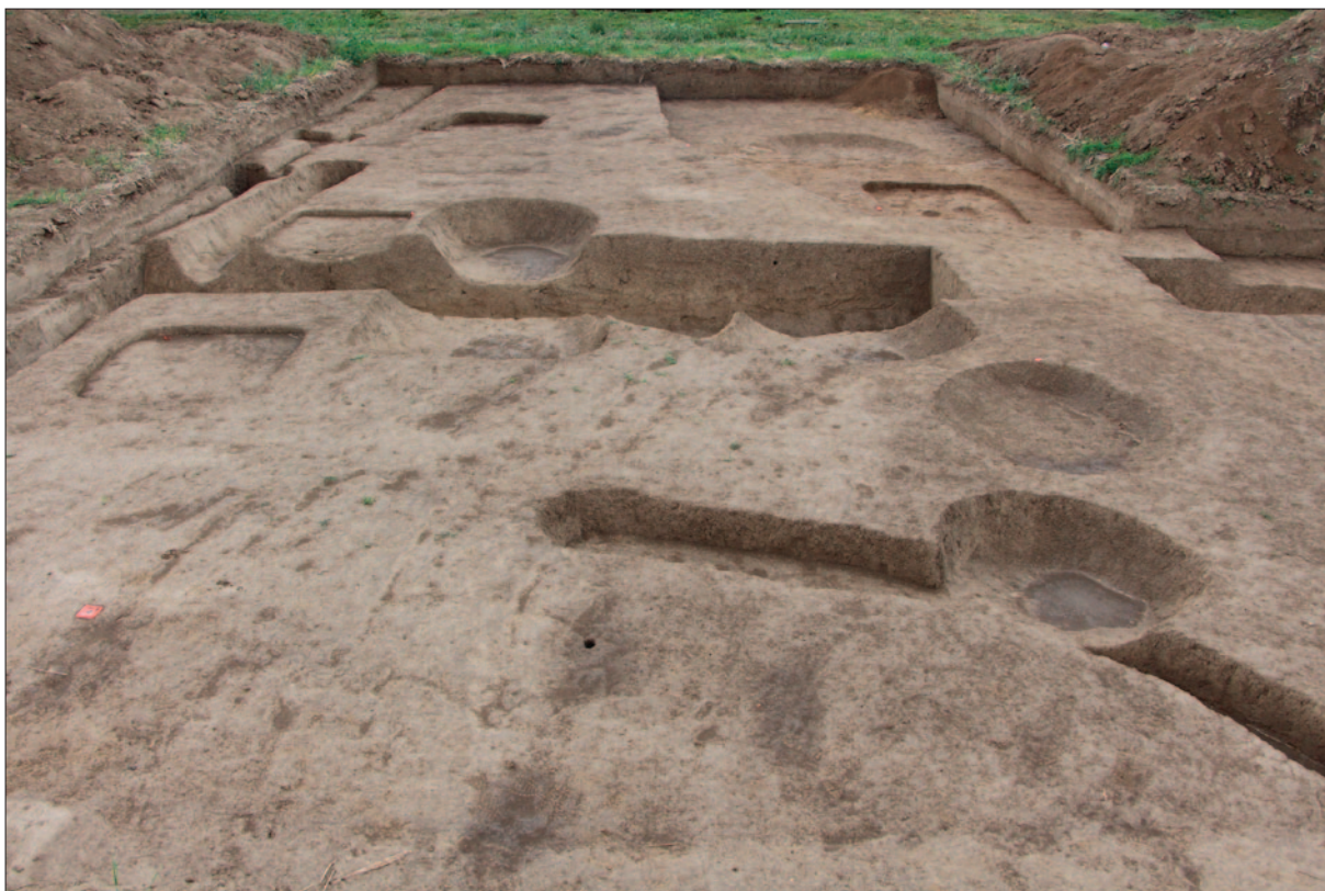
Sl. 2 Istražena sonda 24 – pogled sa zapada

Fig. 1 Excavated trench 23 – a view from the north