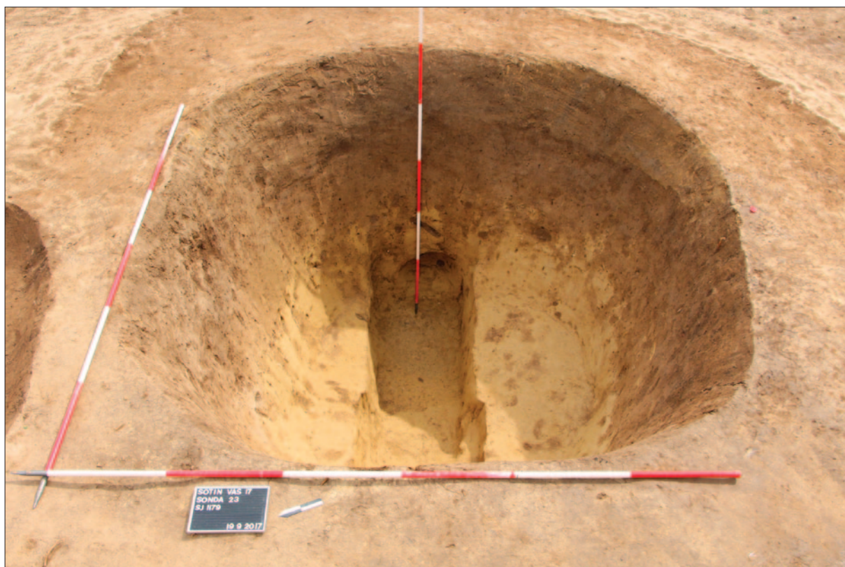
Sl. 7 Podrum SJ 1179