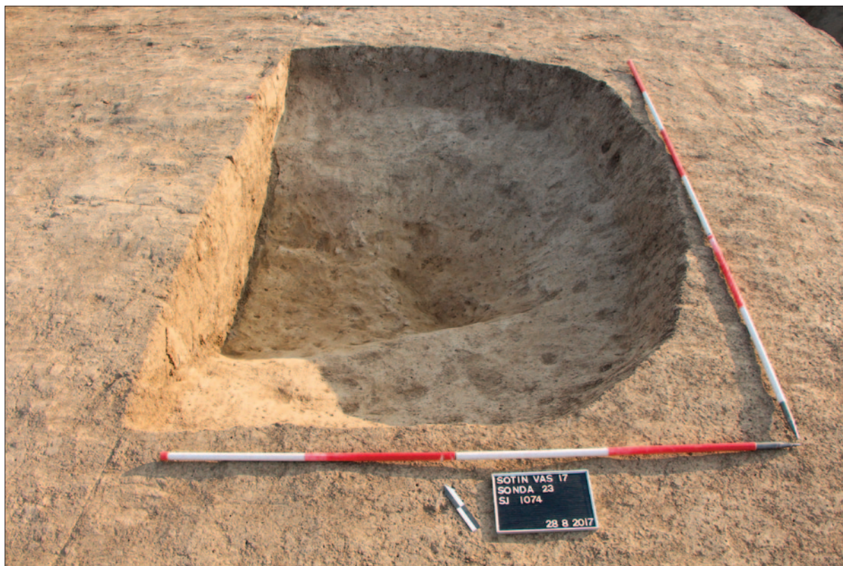
Sl. 6 Istočni dio radnoga prostora SJ 1074