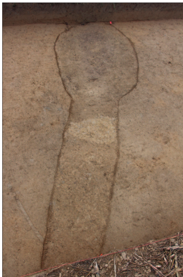
Sl. 3 Zapuna ukopa kanala SJ 91 i zapuna ukopa jame SJ 93 prokopanih radi pljačke tumula 10

Pronađeni ostaci groba 1 iz tumula 10, koji je pljačkan, bili su položeni na istoj razini kao i grob 2, ali sjevernije. Ipak, na osnovi sačuvanih tragova, o konstrukciji tumula 10 sa sigurnošću nije moguće iznjeti više spoznaja. Vjerojatno su nakon polaganja spaljenih ostataka, zajedno s ulomcima keramičkih posuda te rastaljene