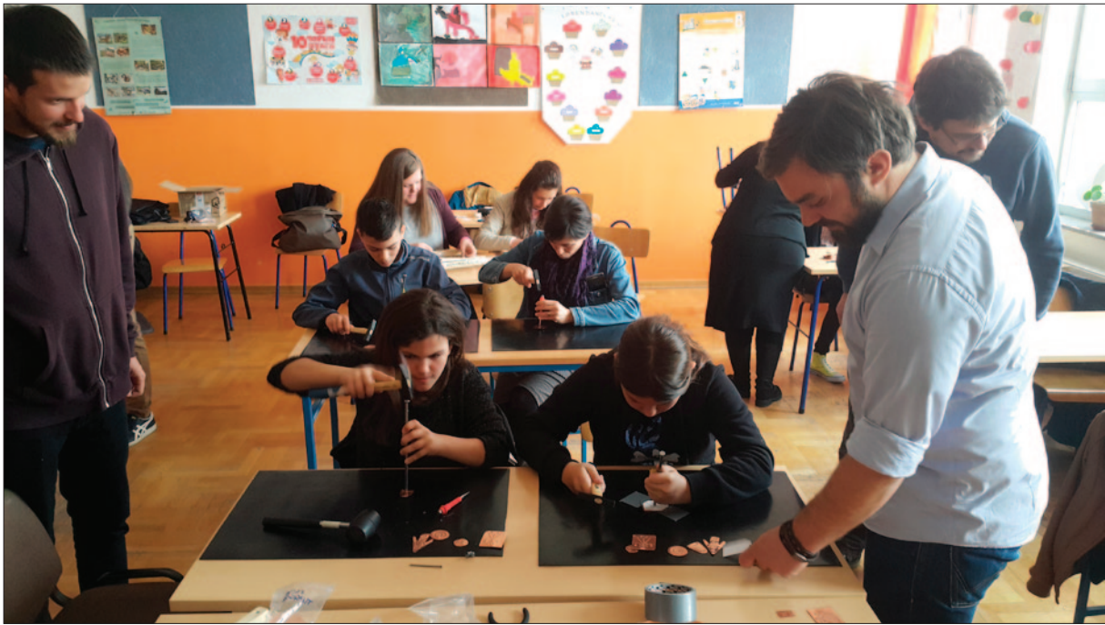
Sl. 2 Izvedba arheološke školske radionice u OŠ Vladimira Nazora u Novoj Bukovici 2017. godine

Fig. 2 Archaeological school workshop performance in ES Vladimir Nazor in Nova Bukovica in 2017