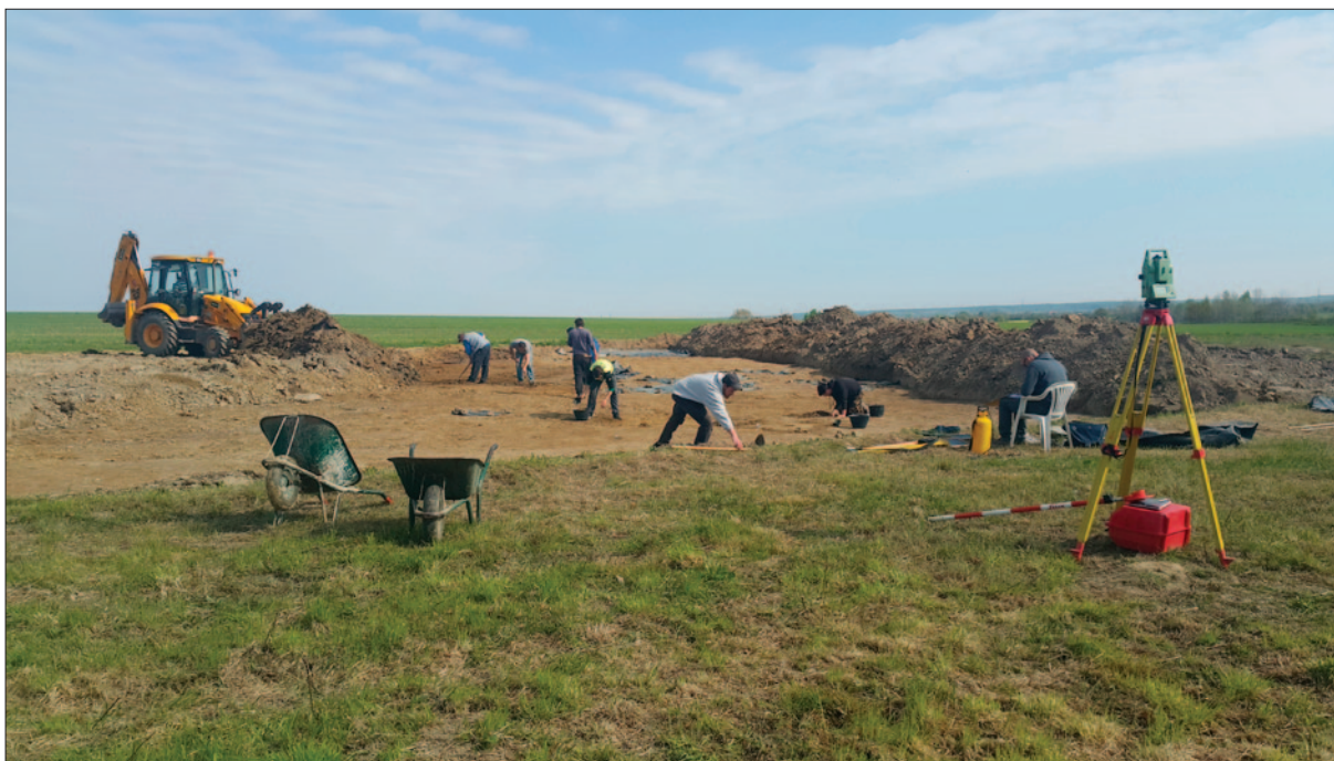
Sl. 1 Sonda 2017. godine tijekom arheoloških istraživanja

Fig. 1 Probe during the archaeological research in 2017