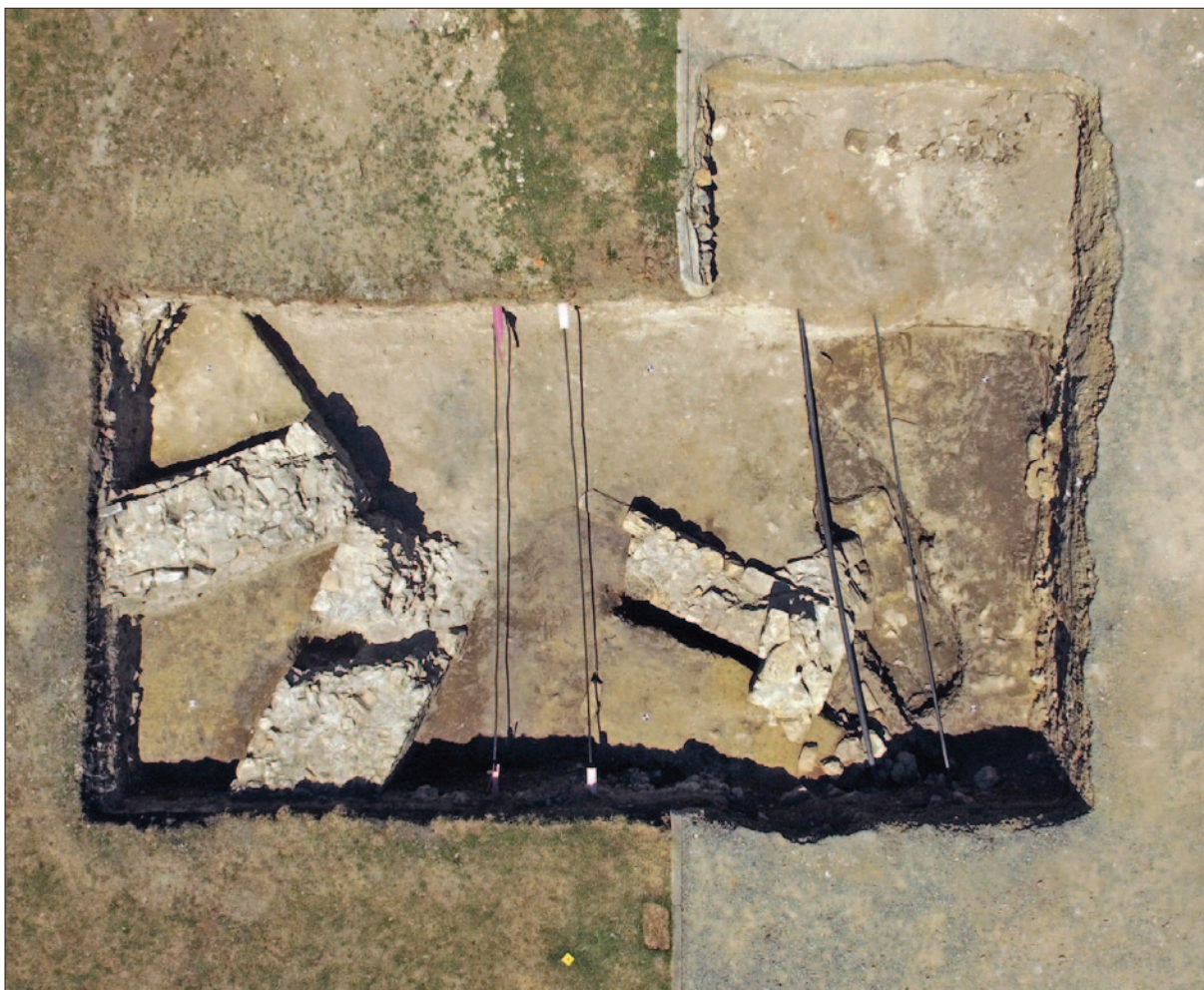
Sl. 4 Sonda 2 – završna orto fotografija