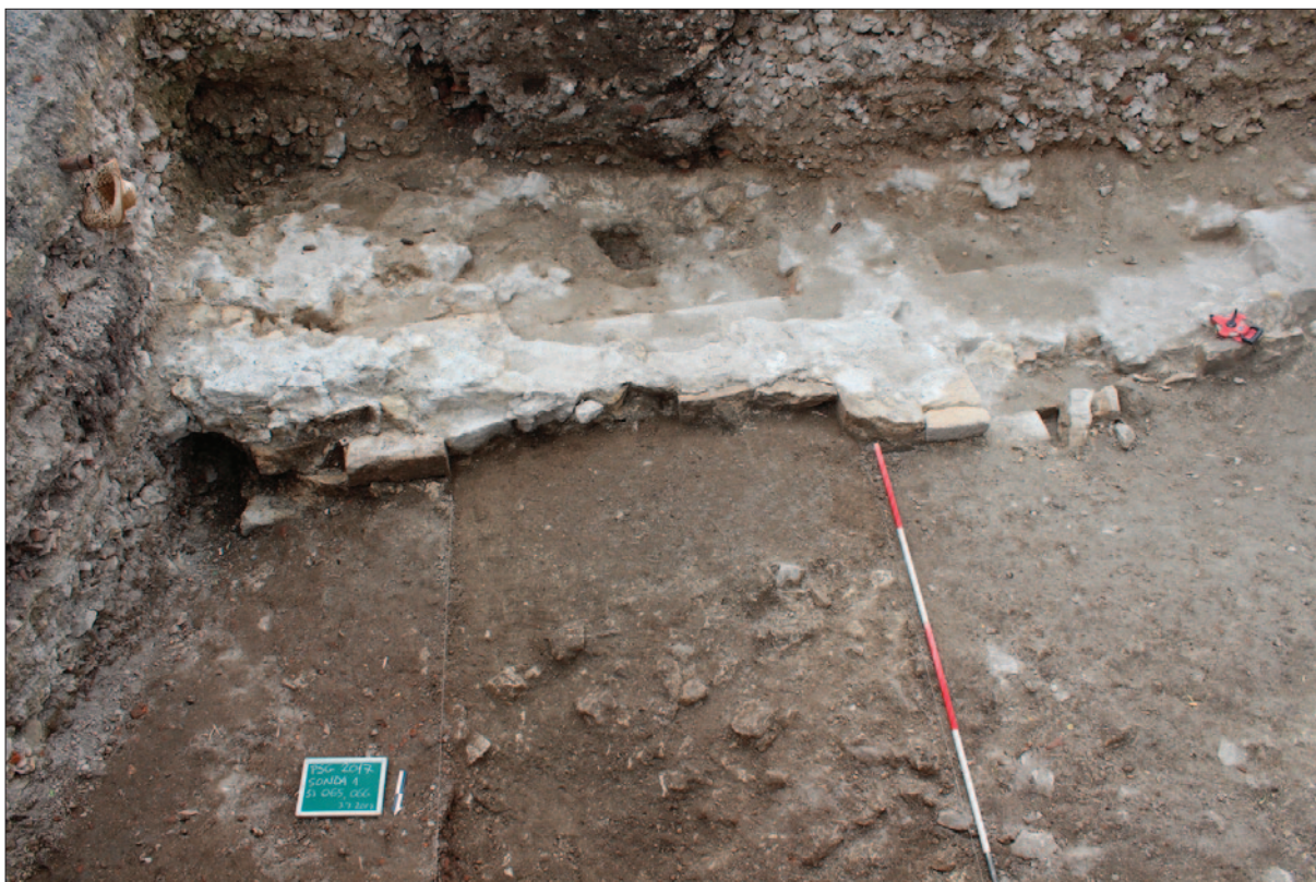
Sl. 1 Sonda 1 pred kraj istraživanja – ostaci strukture građene klesanim kamenjem

Fig. 1 Probe 1 – the remains of the structure built of cut stones