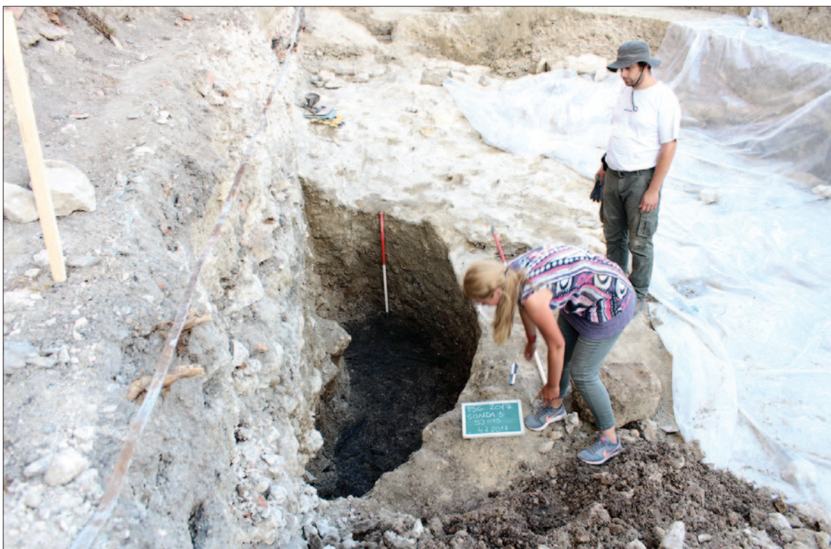
Sl. 5 Sonda 3 tijekom istraživanja