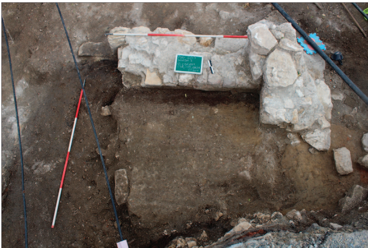
Sl. 3 Sonda 2 tijekom istraživanja