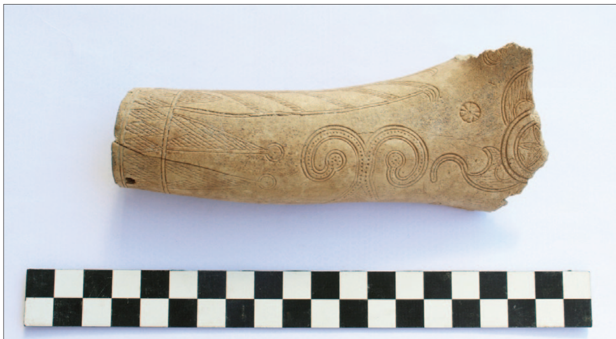
Sl. 9 PN 004 – koštani recipijent za barut Fig. 9 SF 004 – gunpowder holder made of bone