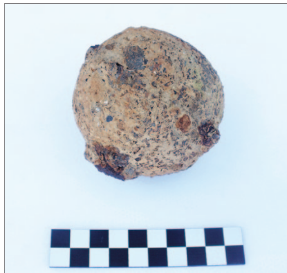
Sl. 8 PN 015 – željezna kugla, dio buzdovana Fig. 8 SF 015 – iron head of a mace