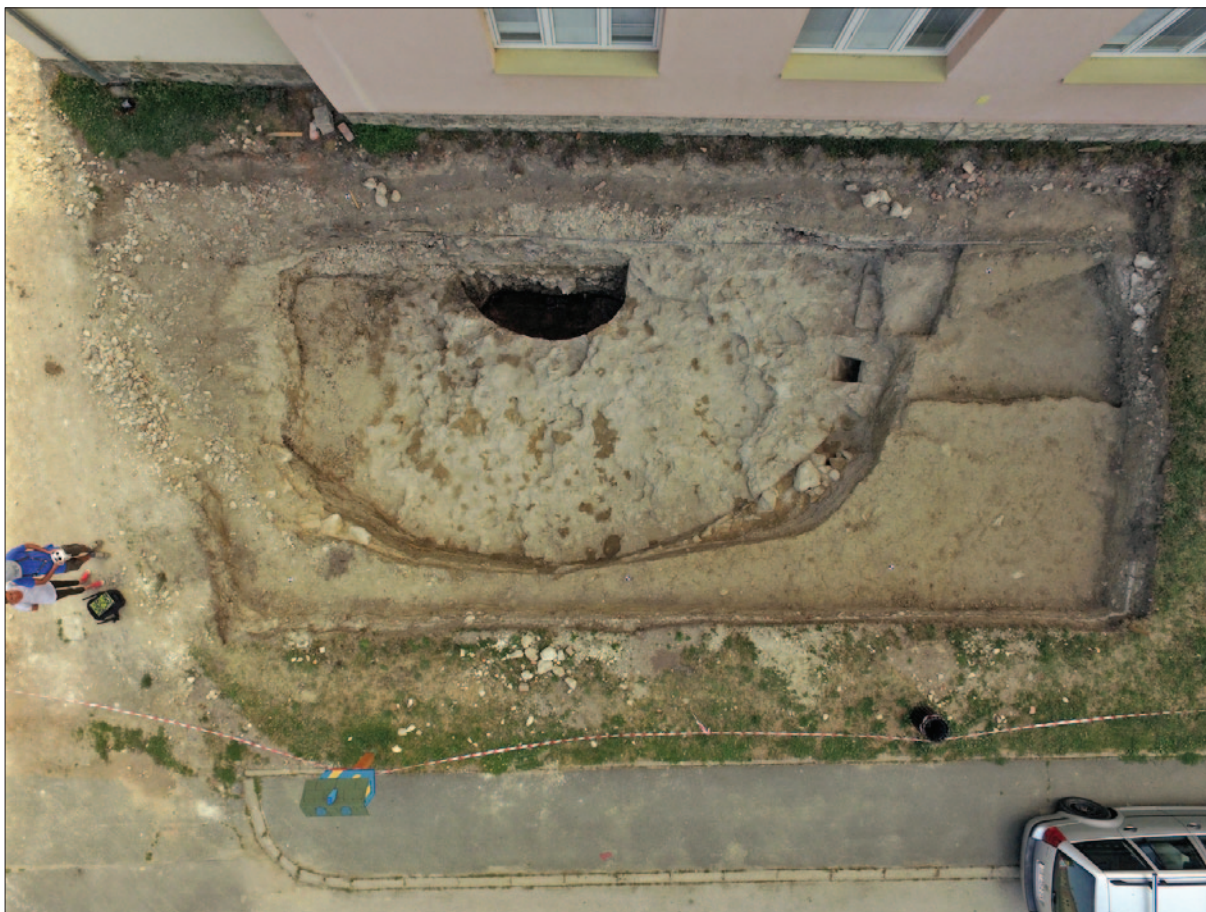
Sl. 6 Sonda 3 – završna orto fotografija (izradio: Kaducej d.o.o. za Institut za arheologiju)