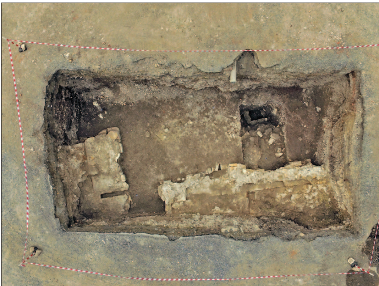
Sl. 2 Sonda 1 – završna orto fotografija (izradio: Kaducej d.o.o. za Institut za arheologiju)

Fig. 1 Probe 1 – the remains of the structure built of cut stones (photo: N. Vrančić)