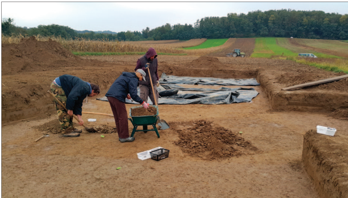
Sl. 2 Lokalitet Carev Jarek u Jalžabetu tijekom istraživanja 2017