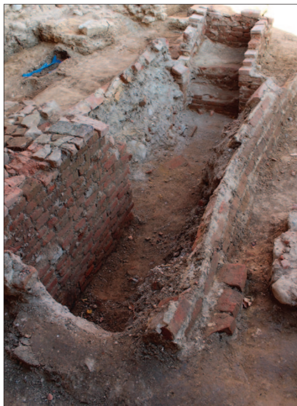
Sl. 2 Pogled s juga/jugozapada na kriptu urušenog bačvastog svoda (SJ 1421)

Grobna konstrukcija SJ 1421 ukopana je u sloj smeđe zemlje (SJ 1420), koji se prostire većim dijelom sonde i unutar kojeg se pronalaze prvi grobovi. Odmah nakon dokumentiranja i vađenja kamenih ploča dizalicom, prionulo se istraživanju grobne konstrukcije. Kao i grobna konstrukcija SJ 1429 i ova je bila izgrađena od opeke vezane žbukom, ali je bila mnogo veća, što može upućivati na to da je riječ o kripti. Također je bila bačvasto presvođena, no svod je najvećim dijelom bio urušen. Očito je i ova grobna konstrukcija bila prekopavana u 20. stoljeću jer je pronađeno mnogo recentnog otpadnog materijala. Istražena je do dubine od otprilike 1,5 m, no odlučeno je da se, zbog sigurnosti, daljnje istraživanje grobne konstrukcije ostavi za nadolazeće kampanje, nakon što se spusti okolna razina zemlje. Na dosegnutoj dubini, zbog veće koncentracije kostiju, mogli bi se očekivati grobovi. Ulaz u kriptu nalazio se na njenom istočnom dijelu, na što upućuju stubbe izrađene također od opeke, koja je