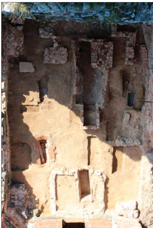
Sl. 1 Pogled na brod crkve tijekom istraživanja

Fig. 1 The view of the church aisle during the excavations