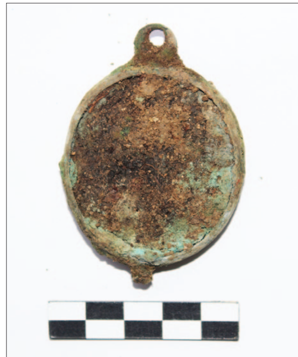
Sl. 6 PN 599 – Brončani brevar