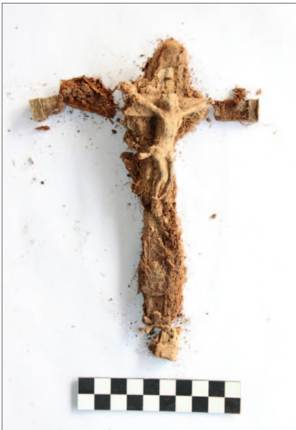
Sl. 5 PN 622 – Ukopni križ izrađen kombinacijom drva i bronce