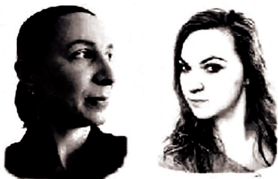
Slika 4 Pojednostavljene fotografije profila lica

U našem slučaju su grafike izrađene od fotografija "en face" portreta te se odokativnom metodom trokutasto selektirao svaki dio fotografije. Nakon toga se selektirani dio stopio u srednju vrijednost njegova obojenja. Tako je izrađena poligonalna mreža, a glavne strukturalne karakteristike motiva su zadržane. Različita obojenja na pojedinim dijelovima su obrubljena kako bi se naglasio oblik lica, kose, usana itd. Na taj način lik ostaje prepoznatljiv. Samim dizajnom ostaje zaokružena tema koja je zapravo prikaz određene osobe, kroz vizualni spektar „low poly art“ dizajnom, a kroz sigurnosnu grafiku pojednostavljenom fotografijom profila lica. Na slici 3. su prikazani „low poly art“ portreti koji su vidljivi u V spektru, a na slici 4. pojednostavljene fotografije profila lica vidljivih u Z spektru.