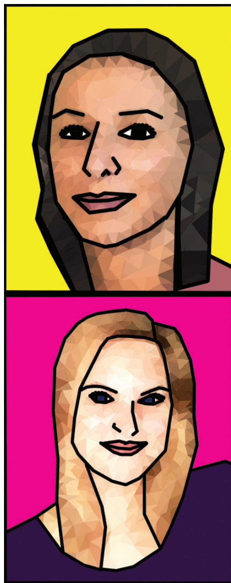
Slika 3 „Low poly art“ portreti

Dizajn slika portreta za vizualni spektar je izrađen uz pomoć „low poly art“ tehnike. „Low poly art“ je tehnika izrade računalne grafike koja se većinom koristi za prikaz 3D grafike. Radi se o prikazu poligonalne mreže gdje se slika pretvara u skup trokuta pomoću kojih se prenosi vizualni dojam obujma, tj. 3D prikaza. „Low poly“ se može izraditi pomoću matematičkog izračuna, ali se isto tako može proizvesti i ručno.