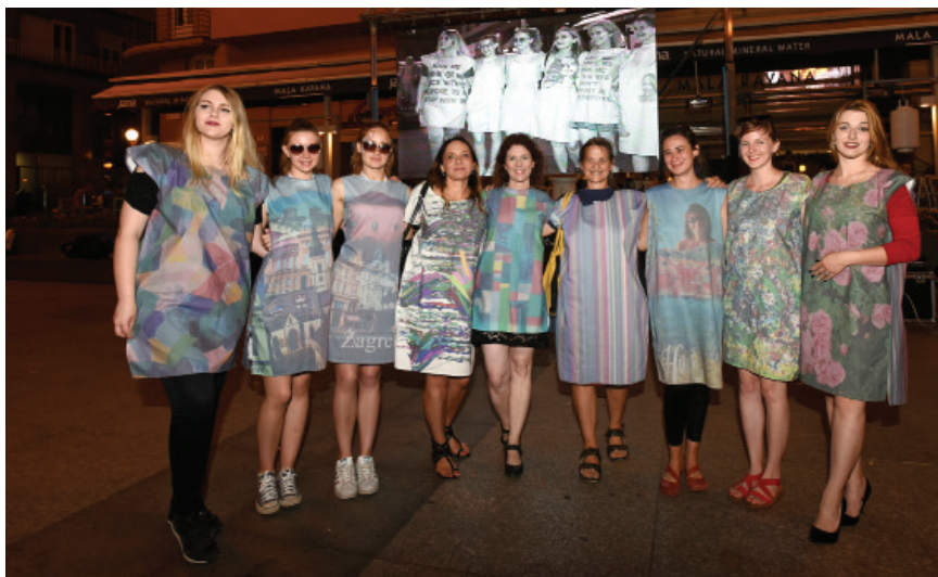
Slika 2 Manekenke-volonterke i autorice revije koje na sebi imaju dizajnersku odjeću; Foto: Nina Đurđević