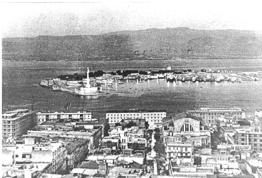
Slika 1. Pogled na luku Messina i svjetionik "Madonnina del Porto" Figure 1. The view of the port of Messina and the lighthouse "Madonnina del Porto"

Formiranjem reljefa zemljišta nastala je prirodna pojava koja je odijelila otok Siciliju i kopno uskim morskim prostorom, širokim samo 3 kilometra. Taj prostor, nazvan Mesinskim tjesnacem ili prolazom, jedna je od dviju spona između zapadnog i istočnog Mediterana, vrlo rano je postao plovni put, omogućivši kasnije, tijekom vremena i tehničkog napretka, znatan robni i putnički promet.