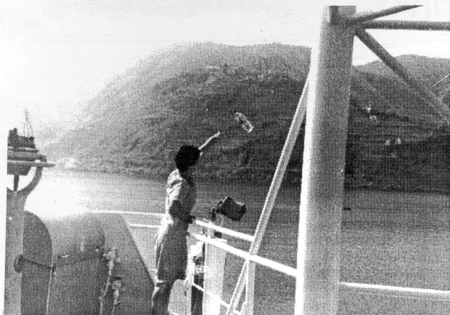
Slika 2. Putnica baca bocu s novcem i porukom (Snimio autor na m/b Sušak)

Figure 2. The passenger throwing a bottle with money and the message