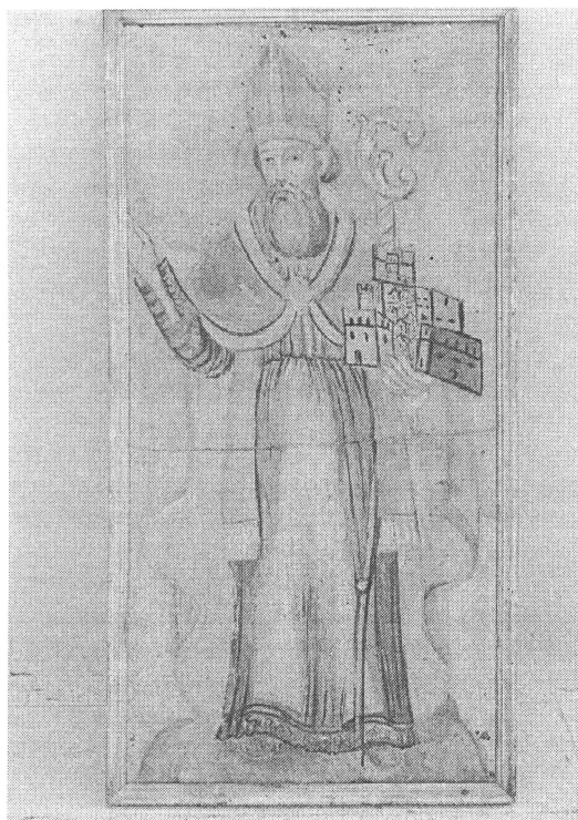
Slika 2. Zastava Dubrovačke Republike iz crkve sv. Martina u Žuljani Figure 2. The flag of the Dubrovnik Republic from St Martin's church in Žuljana

Bilo je više sporednih zastava: tako plava zastava s bijelom pačetvorinom i u sredini s inicijalima S. B.; plava zastava s bijelom pačetvorinom i u sredini s natpisom u jednom retku LIBERTAS; plavo - bijelo -