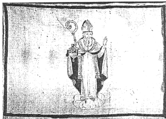
Zastava Dubrovačke Republike, polkraj XVIII. stoljeća, Dubrovački muzej.