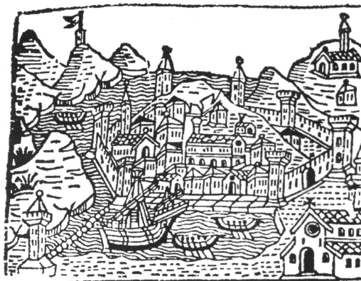
Veduta di Ancona, di Jacopo Filippo da Jesi (1540)

(Copy from Pomorska Enciklopedija - note 2.)