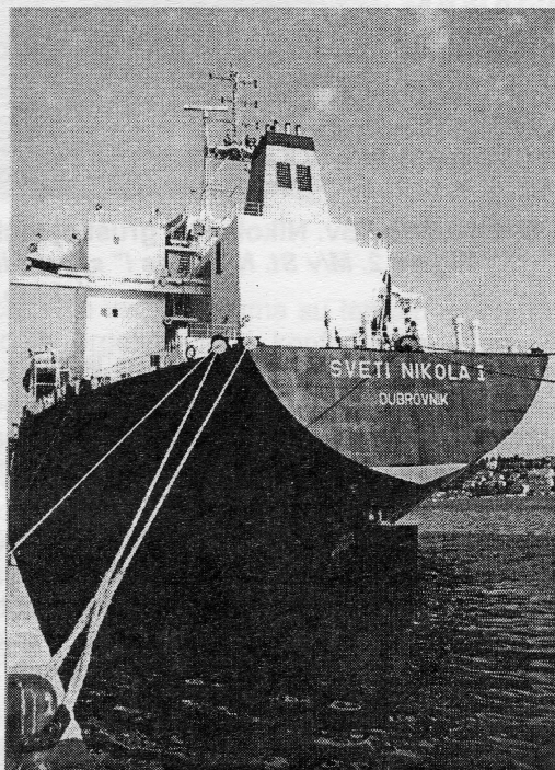
Slika 1. Krmeno nadgrađe m/b "Sv. Nikola I" snimljeno 12. lipnja 1997. prilikom boravka na vezu u gruškoj luci. Figure 1. Superstructure aft of m/v "St. Nicholas I", photo taken while laying at the berth in the port of Gruž

Posadi broda i njenom zapovjedniku kap. Peru Jakobušiću zahvaljujemo na srdačnom prijemu i usluzi pri razgledavanju broda od zapovjedničkog mosta, pa do strojarnice, teretnog uređaja i drugih prostora, a svim zaposlenim u "Atlantskoj plovidbi" srdačne čestitke uz želju da uskoro opet vidimo u Gružu ovakav brod.