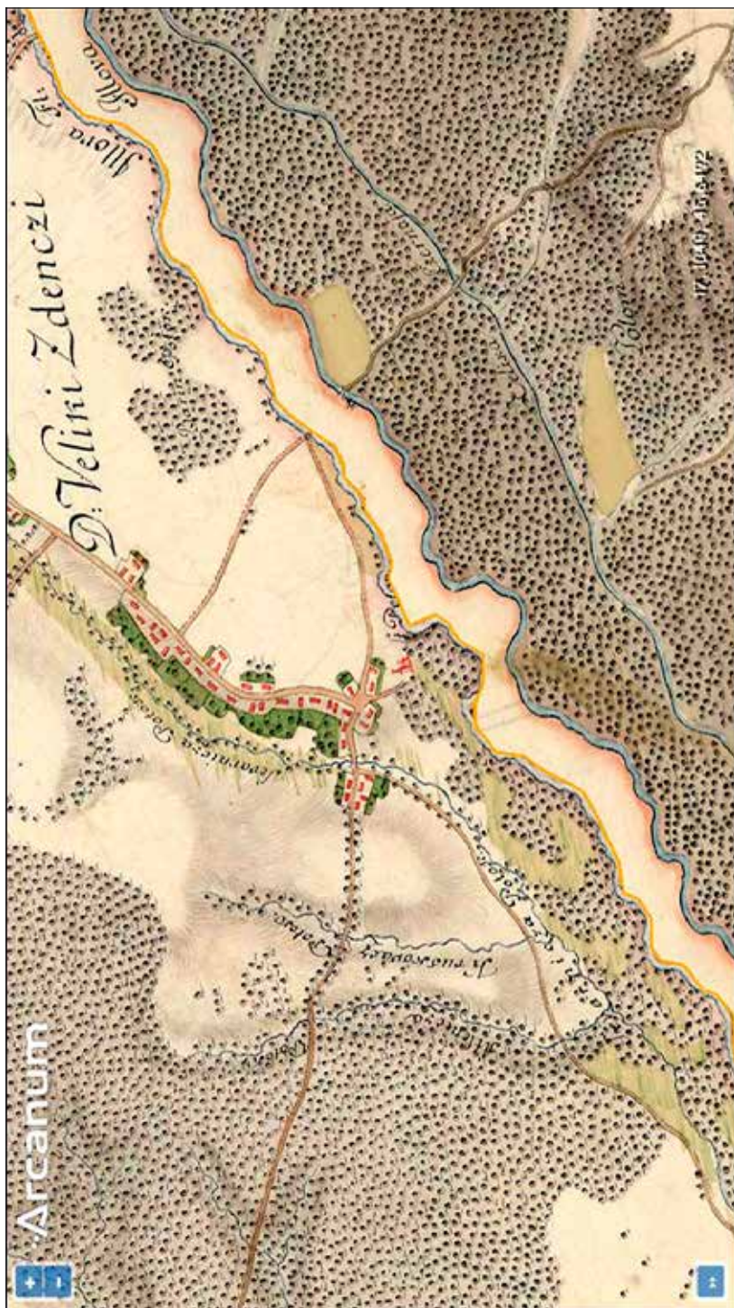
Slika 1. Veliki Zdenci s crkvom sv. Petra na jozefinskoj vojnoj karti