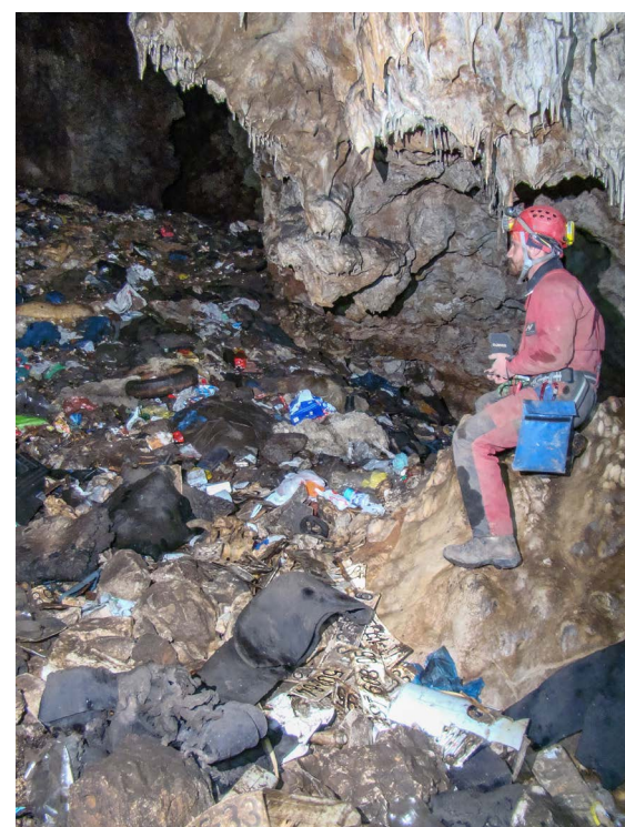
Dno jame prekriveno otpadom.