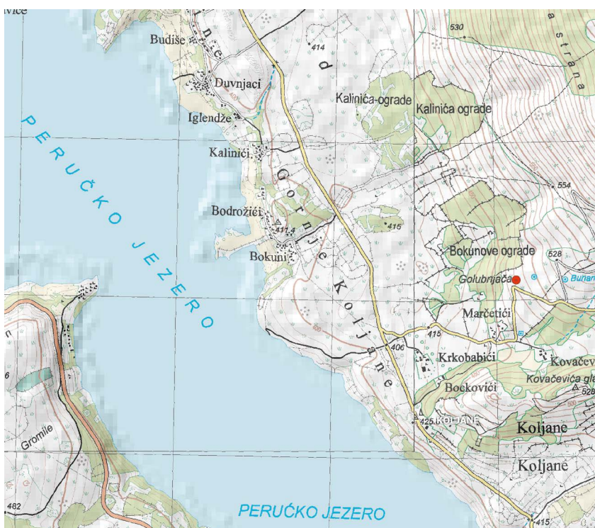
Karta područja s označenim položajem jame Golubnjača

Dno jame prekriveno je otpadom svih vrsta te je kretanje po samom dnu izrazito opasno i neugodno. Glavnina otpada nalazi se ispod južnog ulaza, odnosno ulaza bližeg cesti, ali ga ima i po ostatku jame. Jama je u prijašnjim napisima nazivana i Jama s pločicama, što proizlazi iz činjenice da je u nju ubačena veća količina automobilskih registracijskih oznaka iz brojnih gradova biše Jugoslavije. Zub