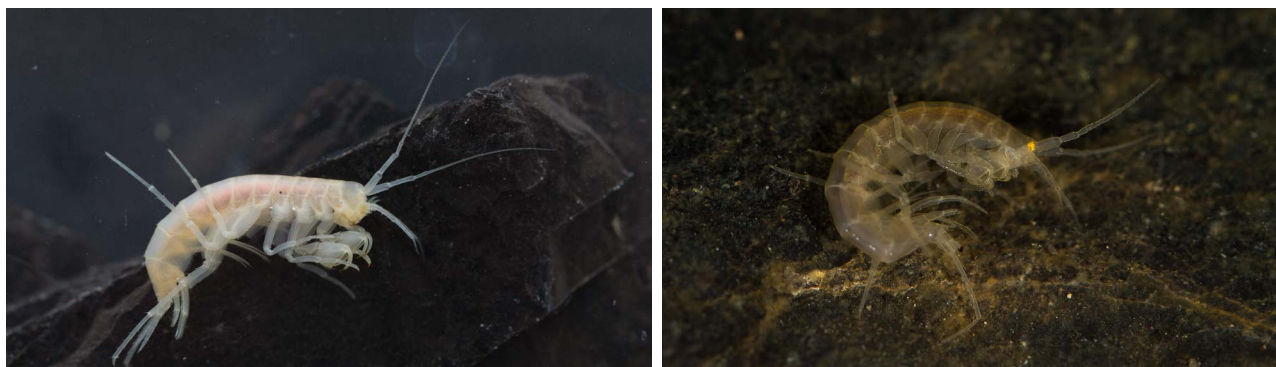
Slika 1 | Predstavnicu analiziranih skupina rakušaca. (A) Niphargus arbeiter (predstavnik kompleksa N. arbeiter – N. salonitanus ). (B) Niphargus stygius (predstavnik kompleksa N. stygius ).

skupina životinja, od mikroskopskih račića pa sve do sisavaca. Do njihova nastanka može doći na više načina, a kada se govori o kriptičnim vrstama, često govorimo o mladim ili pak starijim vrstama. Taj se epitet, naravno, odnosi na starost njihova nastanka, a u sebi može sadržavati i dio odgovora o tome, kako je do njihova postanka zapravo došlo. Do nastanka mladih, morfološki još nediferenciranih vrsta, najčešće dolazi zbog prekida komunikacije među populacijama unutar jedne, predničke vrste. Kao posljedica, tako odvojene populacije razvijaju se u izolaciji, što može rezultirati nastankom novih vrsta. Takav primjer su, primjerice, vrste nastale promjenom visine površine mora. U slučaju rasta površine mora, dolazi do razlijevanja mora po sistemu dolina, dok postojeća uzvišenja nude utočište za izolirane populacije neke vrste. Daljnjim razvojem iz takvih se, u prostoru izoliranih populacija, mogu razviti i nove vrste. Sličan scenarij nastanka vrsta predviđen je i širenjem ledenjaka ili uzdizanjem gorskih masiva. Stare su kriptične vrste jedna drugoj slične zbog sličnih selekcijskih utjecaja. Tako su si često slične posve nesrodne vrste. Morfološke se sličnosti u tom slučaju stječu potpuno neovisno o srodnosti vrsta, odnosno biološkim žargonom rečeno konvergentno.