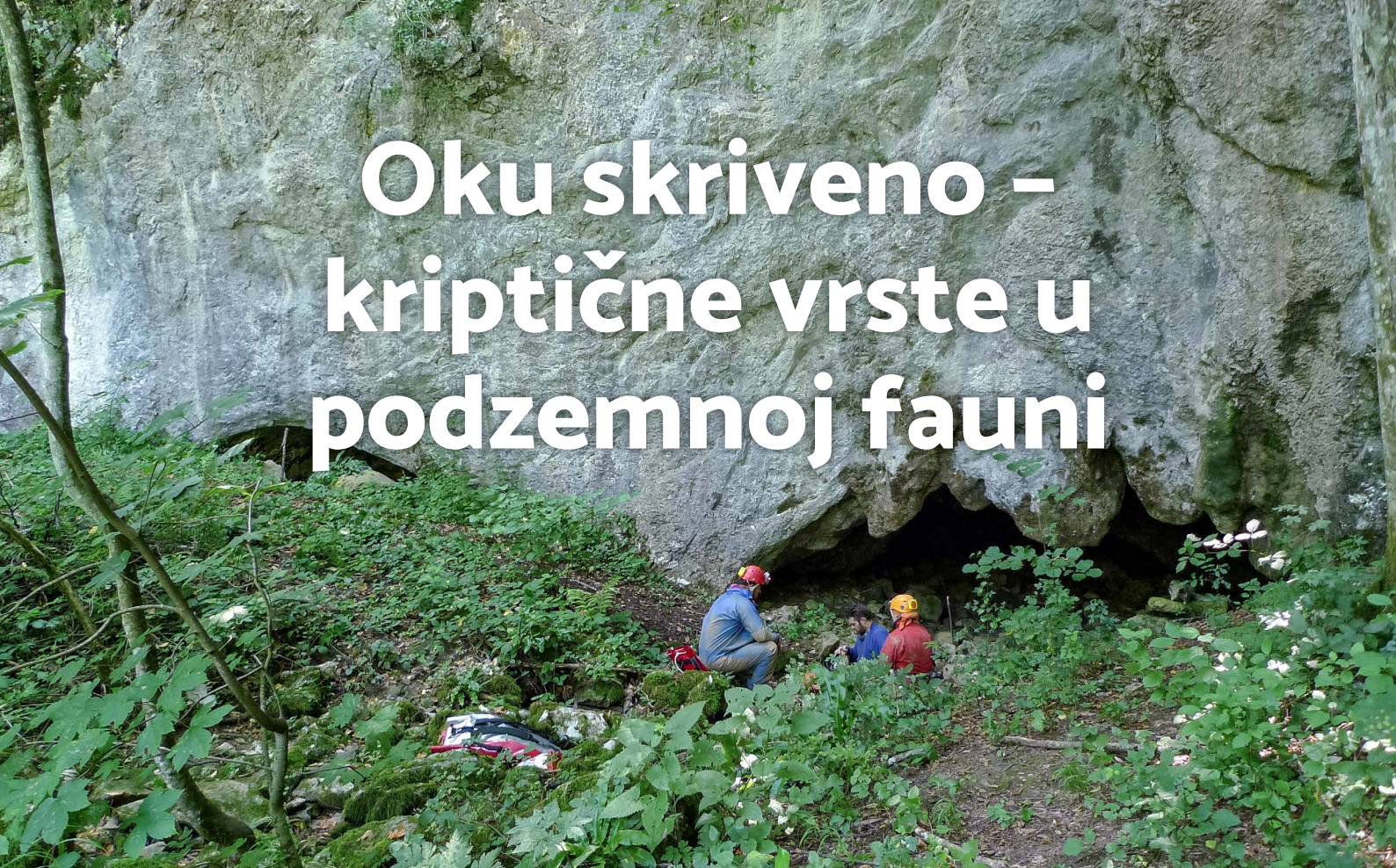
Sustav Matešičeva špilja - Popovača špilja, tipski lokalitet vrste Niphargus kordunensis .