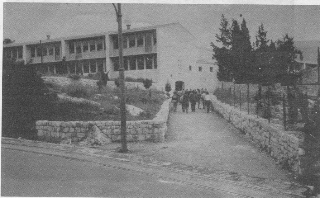
Zgrada Pomorske škole u Lapadu od 1954. godine

njemu obavljali nautičku praksu, a služio je i u privredne svrhe do 1976. godine, kad je prodan zbog nedostatka sredstava za njegovo održavanje.