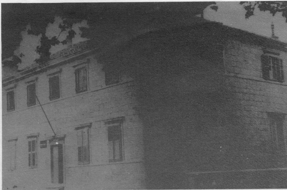
Zgrada NAUTIKE na Brsaljama 1881. - 1954.

je postigla veliki ugled u pomorskim krugovima. Nova reorganizacija počela je 1896. godine. Uvedena su prva dva pripravna, a zatim još tri strukovna razreda, pa je školovanje trajalo 5 godina. Tek tad je hrvatski jezik uveden kao obvezan nastavni predmet. Taj način školovanja trajao je 26 godina, a omogućivao je osim stručnog znanja stjecanje i općeg obrazovanja, koje je dolaskom novih vremena toliko bilo potrebno pomorskim časnicima.