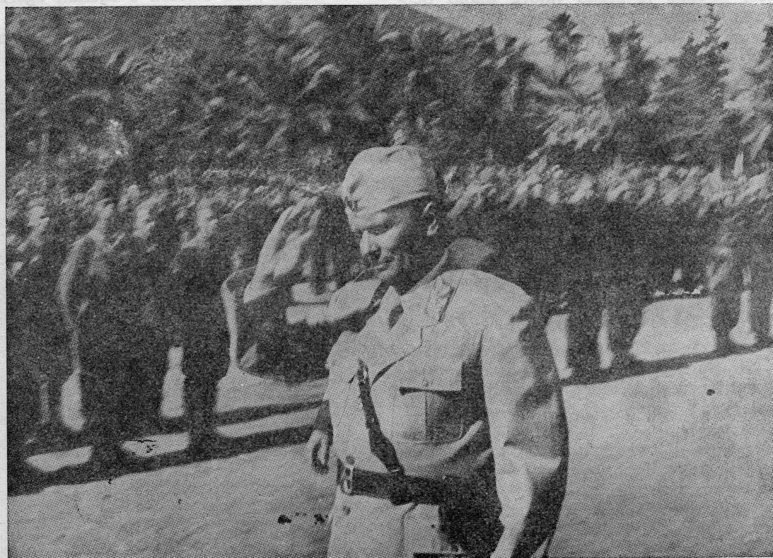
Vrhovni komandant Josip Broz Tito vrši smotru XXVI divizije na Visu 1944.

Devetog dana svibnja ratne 1945. godine u Karlohorstu, predgrađu Berlina, predstavnici njemačke komande potpisali su akt o bezuvjetnoj kapitulaciji svih njemačkih oružanih snaga. Taj dan čovječanstvo slavi kao Dan pobjede. Istog