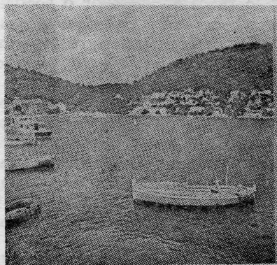
Brna na otoku Korčuli

Smatralo se da je u rješavanju različitosti u stanju mogućnostima i potrebnim uvjetima društveno-ekonomskog razvoja potrebno donošenje odgovarajućih selektivnih rješenja. Da bi se ostvario brži i skladniji razvoj, potrebno je utvrditi programe dugoročnog razvoja pojedinih otoka, postupno poboljšati infrastrukturu i osnovne uvjete života stanovništva na otocima. Za-