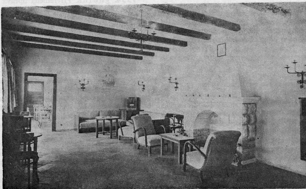
Unutarnji izgled klupskih prostorija Y.K. Argosy 1937. godine

Plovni je park u odnosu na prošlu godinu povećan za 4 jedrilice tipa L-5. Dvije su bile privatno vlasništvo članova kluba, a dvije: »Lero« i »Lorko« klupsko vlasništvo. »Lero« je izgrađen u trogirskom brodogradilištu. Naručen je 1934. godine, a izručen u travnju mjesecu 1935. godine uz cijenu s kompletnom opremom od oko 16.000 dinara. Druga klupska jedrilica »Lorko« (prije Leda II) bila je glavni zgođitak na velikoj klupskoj lutriji. Sretni dobitak postao je klupski član utemeljitelj Gorgje Lučić-Roki (Vis) koji ju je poklonio klubu, zbog čega je imenovan članom dobrotvorom.