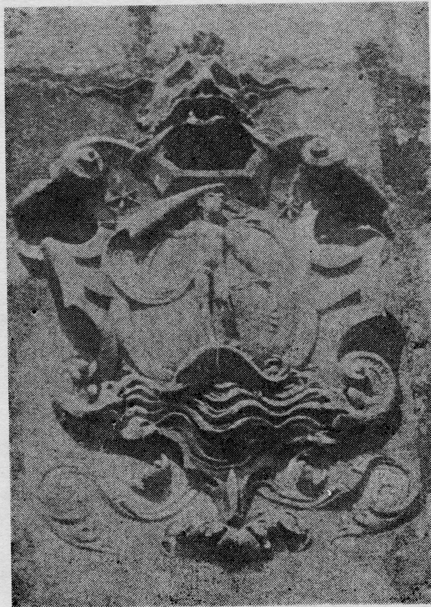
Djevojka s raširenim jedrom na Skočibuhinom porodičnom grbu. Grb se nalazi na pročelju dvorca Vice Stjepovića-Skočibuhe u Sudurđu na otoku Šipanu