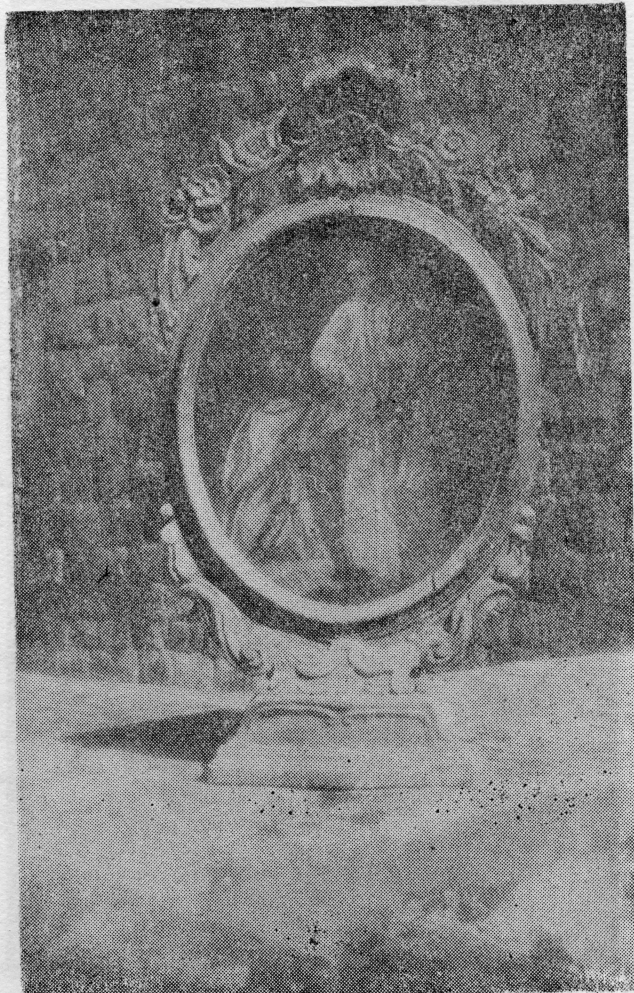
Antunovićeva ili drugog nekog majstora, ova slika u kapelici Skočibuhinog dvorca na Šipanu zaslužuje pažnju i kao umjetničko i kao povijesno djelo

O zvonu kapelice sv. Tome u Skočibuhinom dvorcu u Suđurđu ništa se ne govori ni u jednom od do sada objavljenih radova o Skočibuhinim dvorcima. Razlog je vjerojatno što je zvonu skinuto sa