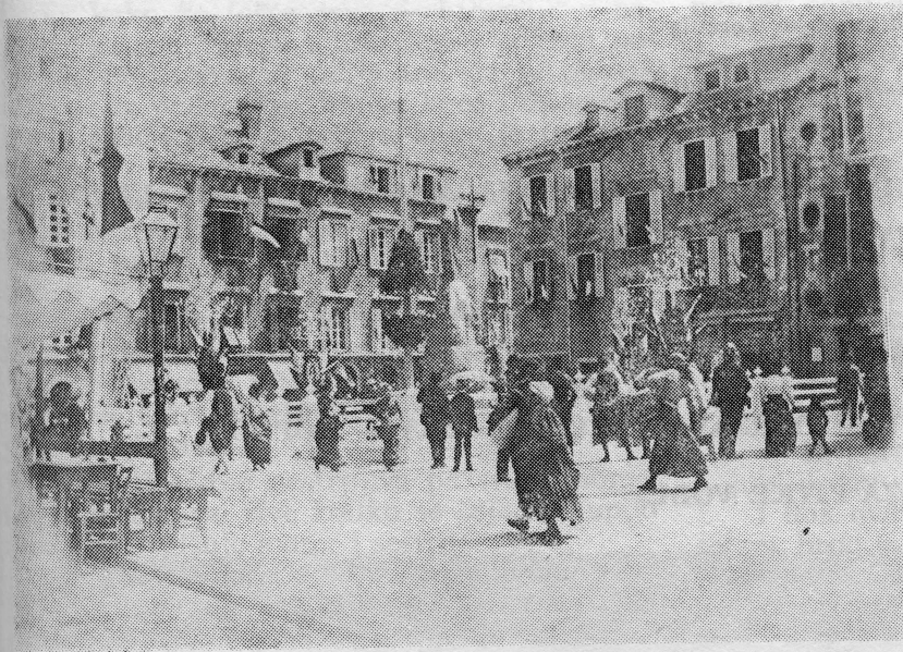
Otkrivanje spomenika Gunduliću 26. lipnja 1893. godine. Trg neposredno pred otkrivanje spomenika koji je još pokriven tkaninom

Reljef na istočnoj strani prikazuje Kizlar-agu, koji za sultanov harem otima Sunčanicu — kćerku slijepog guslara.