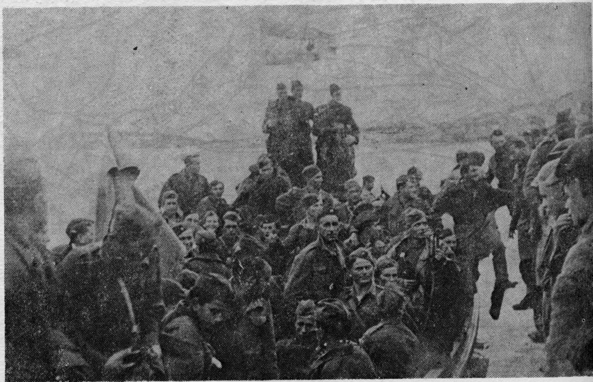
Ratna mornarica pridonijela je završnim operacijama za oslobođenje naše zemlje

Oslobođenje preostalog, istočnog dijela otoka Korčule izvršeno je u rujnu 1944. godine, dakle, nekoliko mjeseci nakon oslobađanja zapadnog dijela otoka. Između ove dvije operacije ima bitne razlike, jer su se njemački okupatori, poučeni porazom u travnju, s istočnog dijela otoka povukli gotovo bez borbe. Mornarica NOVJ i u oslobađanju ovog dijela otoka Korčule odigrala je presud-