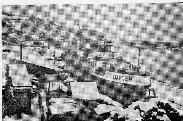
Jedinića Jugoslavenskog riječnog brodarstva »Lovćen« u inostranoj luci

Na riječnim plovnim putovima u SFRJ djeluje 25 većih riječnih pristaništa. Navedena pristaništa imaju svoje Kapetanije pristaništa, odnosno njihove ispostave, kao što na jadranskoj obali postoje lučke kapetanije. Kod navođenja tih 25 većih riječnih pristaništa