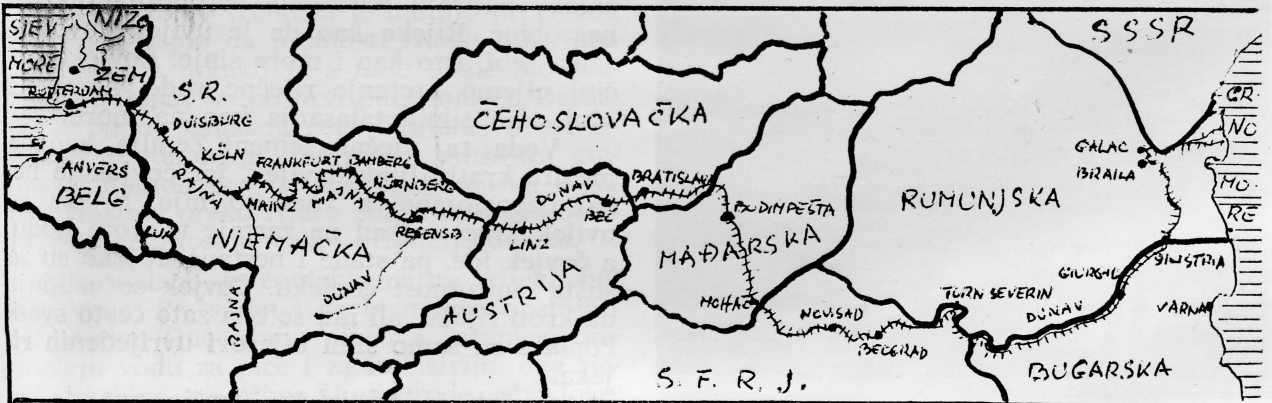
Dunav čitavim svojim plovničkim tokom sačinjava dio plovnog puta koji povezuje Sjeverno i Crno more

Nema te rijeke u Evropi koja bi imala interesantniju deltu i odlikovala se tolikim prirodnim zanimljivostima, kao što je delta Dunava. U zadnje vrijeme ona doživljava sve