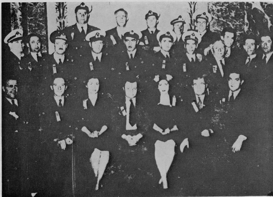
Delegati »Kluba pomoraca Jugoslavije« u New Yorku na II kongresu Američkih Slavena u Pittsburghu, rujna 1944. godine. Drugi red: sjede urednici »Narodnog Glasnika«.

U međuvremenu se, u toku 1943. godine, u SAD pripremala, kroz specijalne treninge za komandose, oveća grupa posebno izabраниh pomoraca. Karakter te grupe otkriva i naziv jedinice kojoj je pripala: Headquarters Company, B, 2677th Regiment Office of Strategic Service (Provisional) Balkan APO 512, U. S. Army. Radi izbora pomoraca za ovu grupu, Adamič se obratio Klubu pomoraca Jugoslavije