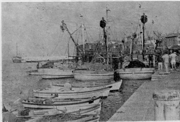
Ribarske koče u Poreškoj luci

teriju, odredbe sva tri zakona međusobno se bitno ne razlikuju. Razlike koje postoje rezultat su specifičnih uvjeta na pojedinim područjima što se odražava kroz odluke koje donose na temelju ovlaštenja iz Zakona općinske skupštine. Zakonodavac je ostavio dovoljno prostora da svaka općina, u okviru općih načela, uredi svoje specifične situacije. Osim citiranih zakona, na snazi su i drugi propisi: pravilnici, naredbe koje donosi republički organ uprave nadležan za poslove ribarstva.