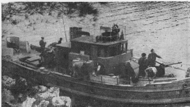
NB-8 »Kornat« učestvovao je (kao predvodnik istočne kolone) u desantnom prepadu na Mljet u travnju 1944. godine

U uvjetima privremene njemačke okupacije na Mljetu je ostao Mljetski NOP odred, koji je formiran koncem prosinca, s jednim brojem pozadinskih radnika, njih ukupno dvadeset i dva.