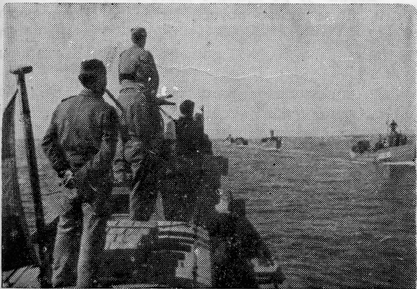
Flotila partizanskih brodova u plovidbi na izvršenje zadatka

Već dio tog oružja odmah se motornim jedrenja-