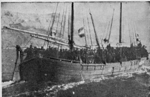
Partizanski brod u akciji prebacivanja boraca

Pripremajući se za desant na Mljet, Nijemci su pojačali izviđanje ovog otoka i Mljetskog kanala u drugoj polovici prosinca 1943. god. U jednoj od tih akcija njihovi avioni su primijetili brod »Vjekoslav« kod uvale Omani u Mljetskom kanalu, koja je plovila iz Polača za Sobru. Nakon višekratnog mitraljiranja brod je znatno oštećen potonuo na dno mora neposredno uz obalu. Partizanskoj posadi je uspjelo da se spasi skakanjem u more. Bilo je to oko 25. prosinca 1943. 10