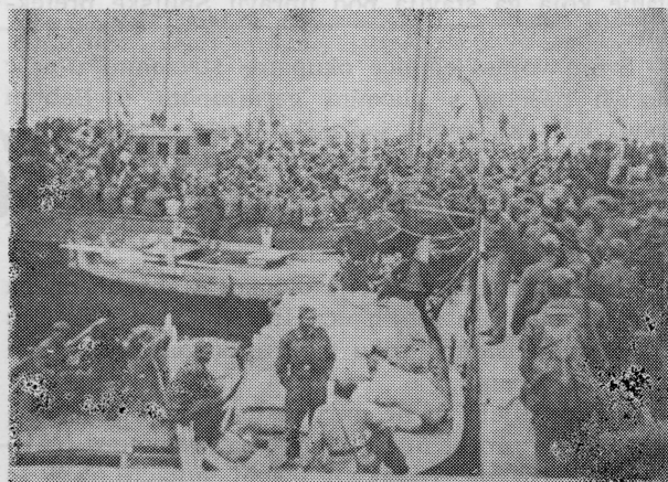
Pripreme su završene — može početi ukrcaj boraca

Tako je posada baterije Vratnička koncem listopada 1943. godine potopila jedan njemački brod od 12000 br. rgs. tona, a drugog uspjela zapaliti. Nakon potapanja s ovog broda su isplivale veće količine razne hrane koje su bile namijenjene njemačkim jedinicama.