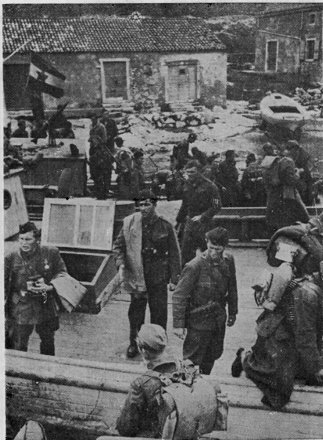
Pripreme za napuštanje otoka

Prema izvještaju Štaba Petog pomorsko-obalskog sektora, Štabu mornarice NOVJ-e o stanju flotile, partizanskih odreda, obavještajne službe, intendature i saniteta od 15. XII, Mljetska flotila je tad raspolagala sa dva naoružana broda »Lapad« i »Vjekoslava« sa bazom u Polačama, gdje se nalazilo lučko zastupstvo. Uskoro se Mljetska flotila popunjava mo-