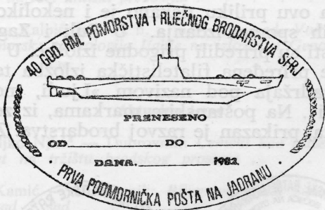
Poseban pečat kojim je obilježena »podmornička pošta«

Za uspomenu sva prenešena pošta obilje-žena je posebnim ovalnim pečatom u kome je ugravirana silueta podmornice, pečatom pošte Hvar, te po jednim prigodnim pečatom posvećenim jubileju Ratne mornarice u Mur-teru, Šibeniku ili Rogoznici.