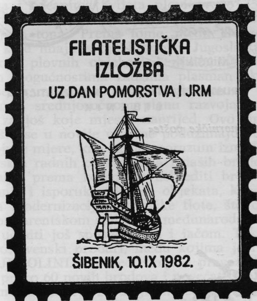
DFN Šibenik - 88