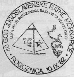
Prigodni pečati uz Dan JRM u Puli, Rijeci i Šibeniku