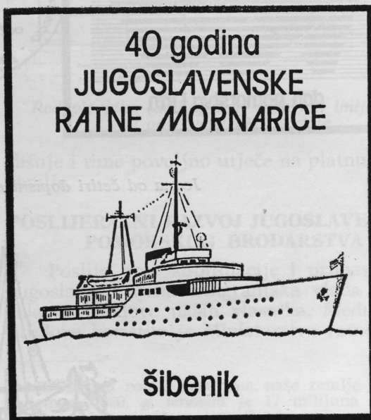
DFN Šibenik - 87

Spomen-dopisnica Društva filatelista i numizmatičara Šibenik tiskanih povodom 40. obljetnice JRM