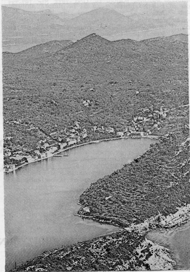
Šipanska luka — panorama

8 Diversi Giuppana, Mezzo, Calamotta. Serija 68.3 b Svez. 1. 1814-1815 str. 40, 48, 55, 130 v (Calamotta)