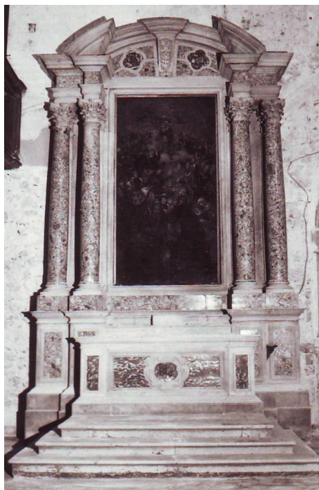
SLIKA 5. Zadar, crkva sv. Frane, Pietro Coste, oltar Svih svetih franjevačkog reda