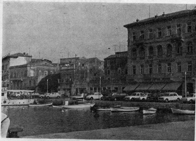
Poreč — pogled na luku

Što je to što privlači goste? Možda je to sadržaj smještaja u malim vilama, bungalovima i sl. objektima u ambijentu šume i tišine, sunca i čistog mora što čini odmor ugodnim. Tu je prije svega svakodnevna