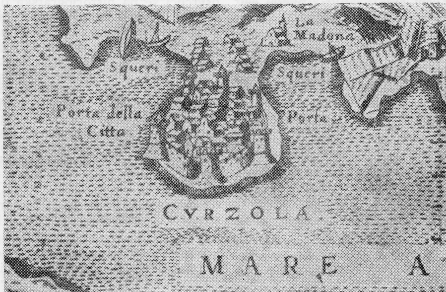
Korčulanska brodogradilišta u XVI št. (crtež iz knjige Camuzio, Isole famose , Venezia 1573)