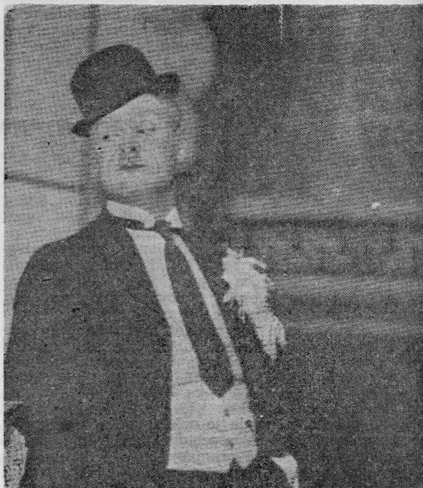
Omiljeni »Šjor Bepo«