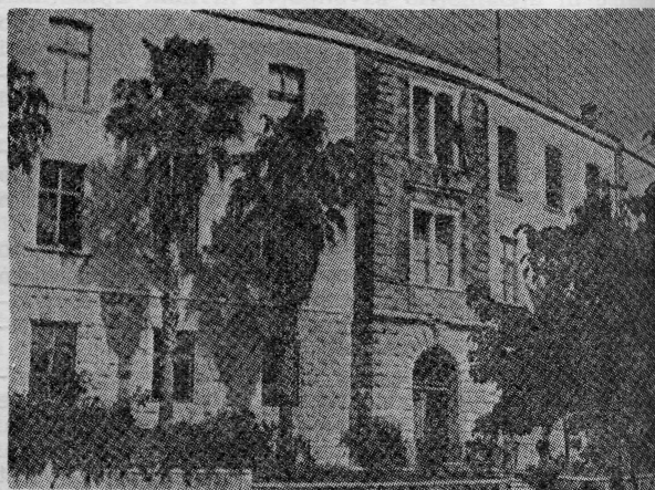
14. I 1926. izvedena je premijera »Mala Floramye«