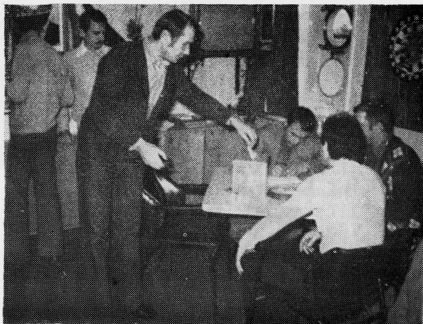
Glasam »za predloženu odluku i tekst samoupravnog općeg akta!

snim zajednicama (na području općine, grane, Republike) ukazuje na specifičnost funkcioniranja delegatskog sistema u pomorskom brodarstvu. Nastojanja da se osigura određena struktura članova delegacija (odnos neposredni pomorci — radnici stručnih službi) stvorila su izvjesne poteškoće u normalnom radu delegacija. Okolnost da se dio delegata uvijek nalazi ukrcan na brodovima izvan domovine i da nije moguće ostvariti njihovo fizičko prisustvo na sastanku delegacije svakako utječe na kontinuitet rada delegacije i na proceduru do donošenja odluke. To je ograničavajući faktor za uključivanje što većeg broja radnika u postupak pripreme i donošenja odluke. Često je neophodno po brzom postupku, na sastanku delegacije, raspraviti i utvrditi prijedlog odluke ili donijeti samu odluku i to o pitanjima veoma važnim za poslovanje radne organizacije, a i šire društvene zajednice, a da nije moguće saznati mišljenje svakog izabranog de-