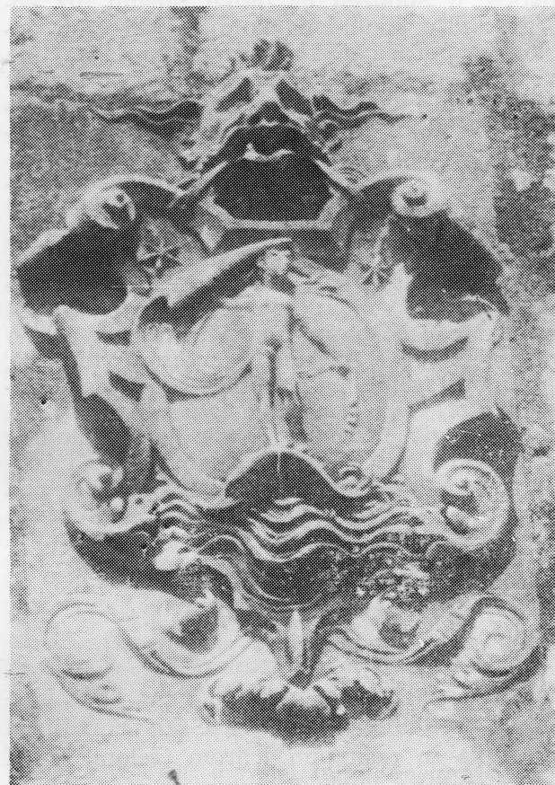
Slika 1. Grb porodice (Grb se nalazi na pročelju dvorca Vice Stjepovića-Skočibuhe u Suđurđu na otoku Šipanu. Visina grba iznosi 75 cm, a figura djevojke u grbu 35 cm)

Međutim, kada je riječ o Skočibuhinom porodičnom grbu postoji još jedan mnogo važniji momenat na koga valja ukazati. U vremenu u kome je živio Tomo Stjepović — Sko-