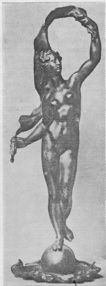
Slika 3. Danese Cattaneo: »Fortuna« (Visina 50,1 cm) Djelo se čuva u Nacionalnom muzeju Bargello pod imenom »Venere Marina«

Koliko se do sada zna Danese Cattaneo nije dolazio u Dubrovnik. Ali Tomo Stjepović — Skočibuha i kao pomorac i kasnije kao posjednik i bogat čovjek, jednako kao i neki od njegovih sinova — posebno Marin i Vice — često su odlazili i boravili u Firenzi i Veneciji odakle su poručivali umjetnički izrađen namještaj, slike kao i druge predmete i ukrase za svoje dvorce u Dubrovniku. 6 I sasvim je realno na osnovu toga pretpostaviti — jer je teško kategorički tvrditi i za sada dokumentima potkrijepiti — da su se Tomo Stjepović — Skočibuha, kao jedan od najistaknutijih dubrovačkih privrednika 16. stoljeća i kulturni čovjek zainteresiran za umjetničke slike, predmete i drugo, 7 i njegovi sinovi Marin i Vice, kao ljudi koji su se također neobično mnogo zanimali za umjetnost, dobro poznavali s Cattaneom, a moguće su i prijateljevali, što je utjecalo na Skočibuhu da Cattaneovu »Venere Marinu« ukomponira u svoj grb!? U dokaz te pretpostavke može poslužiti činjenica da je Danese Cattaneo bio veliki prijatelj Giorgia Vasaria, 8 a zna se opet da je Giorgio Vasari za poznati oltar porodice Skočibuha u Domini-