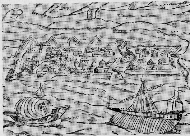
Zadar XVI st. Naslovna stranica drugog izdanja Marulićeve »Judite« (Mleci, 1522)

OUR TURISTHOTEL: Hoteli u zadarskoj okolici — kopnu i otocima; MARINA — Zadar, unajmitelj, opskrbljivač i serviser svih vrsti jahta i sportskih čamaca. Poseban servis brodskih motora VOLVO PENTA i opskrba svim rezervnim dijelovima.