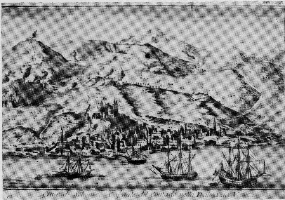
Šibenik, stara gravira iz 1753. godine