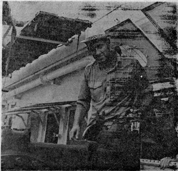
Naši pomorci uvijek puni vedrine ali i vrsni radnici

u luci, jer na taj način zajedno s mornarima na njima mogu dati oduška onom divnom osjećaju »baš me-brizma«, kojim su naveliko zadojeni svi radni ljudi na kopnu, misleći prilično nastrano da se jedino naivni moreplovci moraju besmisleno klatariti po uzburkanoj pučini u vrijeme kad nitko živ na zemlji ne radi. U tom pogledu društvena svijest jedino je napredovala u radnim organizacijama kojima nisu dovoljna ni ona dva crveno obilježena praznična dana, nego ponekad pokušavaju spojiti još koji dan prije velike svetkovine a poslije nje u sasvim zgodan »Tjedan Nove godine«.