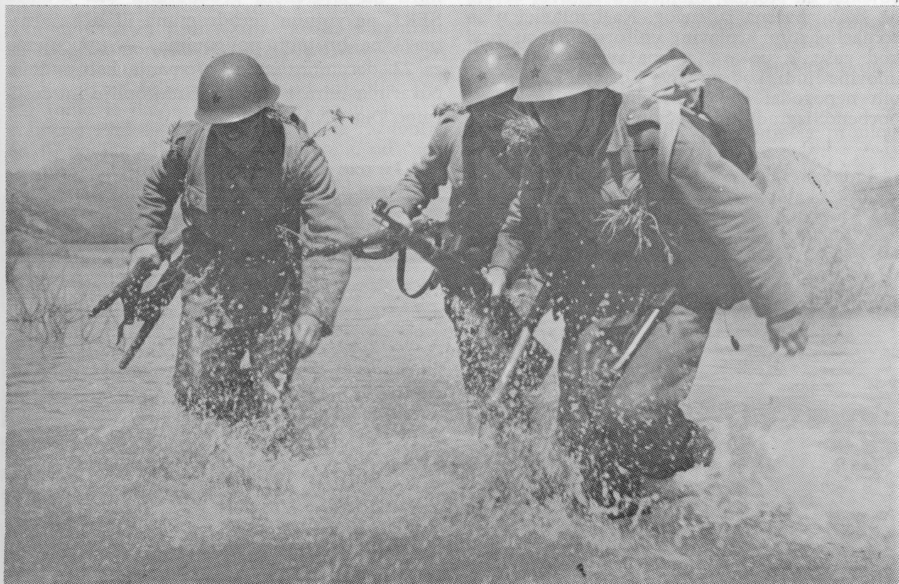
Pripadnici naših oružanih snaga osposobljeni su za izvršavanje zadataka, kako na kopnu, tako i na moru i obalnom rubu

vila je strategijski front od Jadranskog mora do Dunava i Drave. Ona je tako samostalno držala u završnim operacijama antihitlerovske koalicije dio strategijskog fronta oko nacističke Njemačke i povezivala lijevo krilo Crvene armije u Mađarskoj, i desno — prema zapadnim saveznicima u Italiji. Ubrzo zatim, prema direktivi Vrhovnog komandanta maršala Tita, u završnim je operacijama Jugoslavenska armija probila front u Lici i Srijemu i desnim krilom, dolinom rijeke Drave, odlučno prodirala prema Koruškoj, a lijevim — oblasnim pojasom sjevernog Jadrana, prema Trstu i Soči, odnosno gornjem toku rijeke Drave. Time je zatvoren обруч oko njemačke balkanske grupacije u oblasti Julijskih Alpa i Karavanki, dok su istovremeno nastupale snage iz centra na sjeverozapad, preko Karlovca i Novog Mesta duboko u Sloveniju, čime je stavljen pred svršeni čin već okruženi neprijatelj. Tako je u završnom obračunu Jugoslavenska armija nanijela neprijatelju veoma teške gubitke od preko 100.000 mrtvih i 200.000 zarobljenih. U ruke pravde je pao i general von Lehr, njemački vrhovni komandant za jugoistok, a zarobljeni su i štabovi grupe armija »E«, te 91. i 97. armijskog korpusa. Oružje su morale da polože i operativne jedinice, kao 237., 181., 41., 22. pješadijska divizija, po jedna brdska, lovačka i poljska zrakoplovna divizija, tri legionarske divizije, zlo-