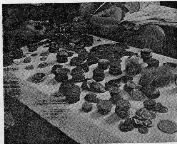
Selekcija pronađenog bakrenog, srebrenog i zlatnog novca

Nikakav komad drvene građe broda nijesu našli. U 350 godina od brodoloma nije nikakvo čudo da je mrtvo more i nevremena sve to raznijelo i polupalo. Ovo istraživanje se obavljalo na oko dvadesetak metara od obale. Zbog vrlo strme obale dubina na kojoj su ronioci radili je varirala od deset do trideset i više metara, a vrijeme upotrebljeno za ovo je bilo u vremenu dva perioda ljetnih mjeseci.