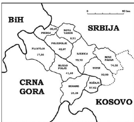
KARTA 1. Relativni udio Muslimana (%) u nacionalnoj strukturi općina na Sandžaku 1991. g.

Forum za sigurnosne studije GOD. 2, BR. 2