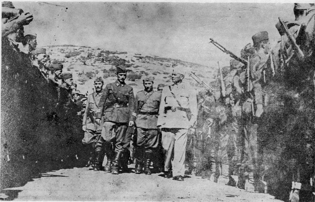
Sa smotre Prve dalmatinske proleterske brigade — Vis, rujan 1944.

I sada kada ga fizički više nema među nama, kada se moramo pomiriti sa gorkom istinom da ga narod obale i otoka, pomorci naši, kao i ostali ljudi naše domovine više neće ispraćati niti dočekivati, naša se ljubav, odanost i poštovanje prema njemu pretvara u neizmjernu tugu iz koje se rada spoznaja i čvrsta odlučnost da i bez njega nastavimo putem kojim smo skupa s njim i pod njegovim rukovodstvom hrabro, prkosno i uspješno koraćali više od četiri decenije, ostvarujući neslućene domete u izgradnji naše zemlje, njenog ugleda, njene snage i njenih perspektiva.