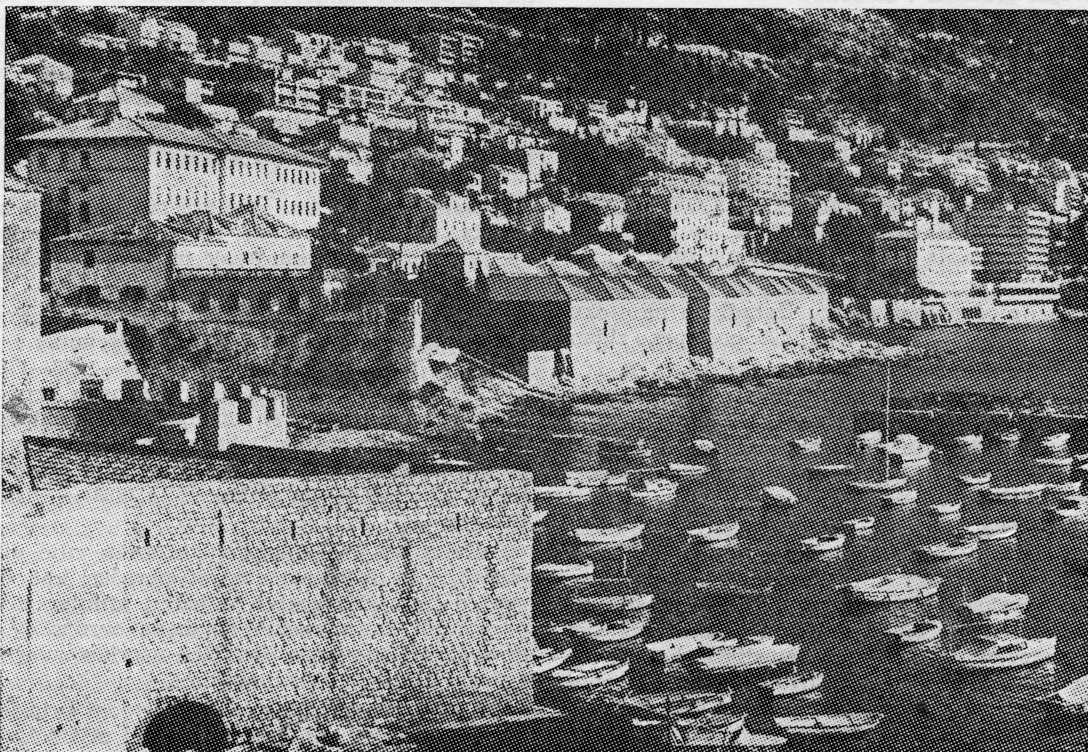
Čuveni dubrovački »Lazareti« — Karantena za ljude, živu stoku i raznu trgovačku robu. Zgrade »Lazareta« se vide između današnjeg hotela »Excelsior« i Gimnazije »Marija Radeljević«.

7. Nijedan Turčin ili Murlak ne smije ući u Grad, ako ga prije ne vidi i ne pregleda prior i ne dađe mu dozvolu.