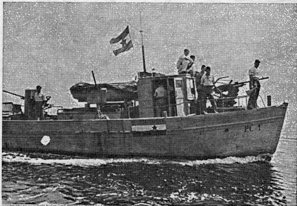
Naš ratni brod PC 1 za vrijeme NOB-e

Po oslobođenju Mljeta, Korčule i Pelješca neprijatelj se učvrstio na visovima oko Stona u cilju spriječavanja jedinica 26. divizije da presijeku za Nijemce toliko važnu cestu Dubrovnik — Mostar, a jedinicama 29. divizije da vodi operacije za oslobođenje Dubrovnika. Samo u borbi za Ston naše jedinice su zarobile 200 njemačkih vojnika, 8 oficira i zaplijenile oko 200 pušaka, 20 mitraljeza »šaraca«, 3 protivavionska mitraljeza. U ovim trenucima i pitanje dubrovačkih otoka postaje sve aktualnije. Ti otoci, u prvom redu Jakljan, Šipan, Lopud i Koločep, ako bi njima vladao neprijatelj, mogli bi da otežaju i uspore nastupanje našim jedinicama ka Dubrovniku. Konkretno izvršenje zadatka u čišćenju otoka povjereno je 1. bataljonu mornaričke pješadije, koja dobro poznaje