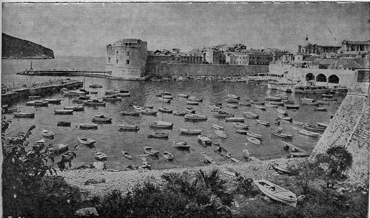
Dubrovnik — stara gradska luka

Pomanjkanje bržeg prevoznog sredstva ometa uspostavljanje ove veze i sprečava siguran i koristan rad u cilju prikupljanja novog kadra za NOVJ, što naročito važi za dubrovački kotar... Ima slučajeva da su se pojedini dobrovoljci koji su izišli iz Dubrovnika,