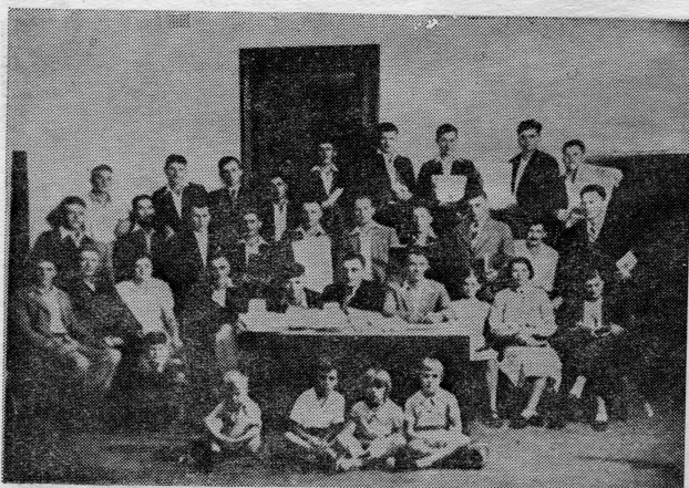
Članovi kluba »Jedinstvo« u Swannu, W. A., 1935. g.