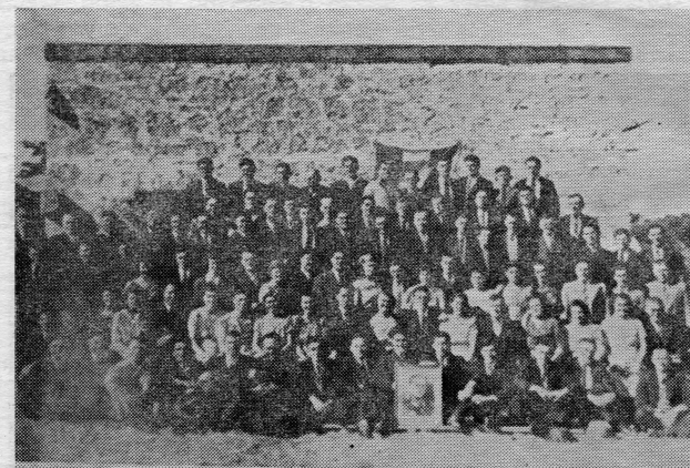
Članovi ogranka »Napredni« organizacije jugoslavenskih iseljenika u Spearwoodu, W. A., 1946. godine