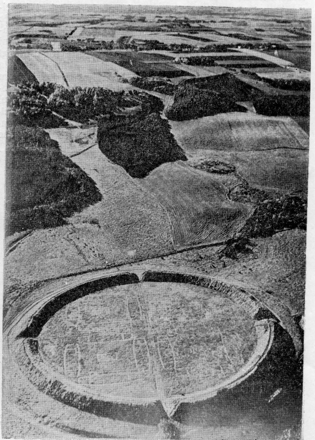
Iskopine starog Vikinškog tabora blizu Hubba u Danskoj

U periodu između 800. godine, u kojoj su prvi Normani kolonizirali Färer otoke, do 1000. godine, kad stupa prvi put na kopno Sjeverne Amerike, oni su ovakvim brodovima istraživali više od 3.000 milja prostora na nepoznatom oceanu. Međutim, prestano se nameće pitanje kako su Vikinzi mogli ploviti tako sigurno po tor. vodenom prostranstvu. Evo ključa: »U sagama (nordijske priče) pominje se »Solarstein« ili »sunčani kamen po kojem su mogli navodno određivati položaj Sunca za vrijeme naoblake. Neki stari Islanddanin, po imenu Star-Oddi, ostavio je kartu sunčeva položaja u zoru i u podne za cijelu godinu. U nekoj razvalini na Grenlandu u gledao je dio okrugle drvene ploče koja je možda služila za određivanje tih odnosa. Oslanjajući se na sve te izvore, zaključuje arheolog Thorhild Ramskou da su Vikinzi zaista imali neki sunčani kamen. Objavivši o tom pitanju članak u kojemu nagada o sunčanom kamenu, dobio je odgovor od Jørgena Jensena, stručnjaka za navigaciju skandinavskog zračnog prometa. On ga obavještava da slične ali usavršene sprave vode danas zrakoplove kroz