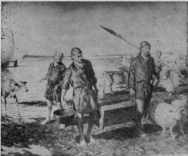
Vikinzi naseljavaju zaposjednuta područja u IX stoljeću

Drugi sin Erikov Thorvald istražuje američki kontinent još dalje. U nekom predjelu još neorane zemlje našli su on i njegovi istraživači na ljude u kožnatim čamcima. Bijahu li to Indijanci ili Eskimi? Od devatorice oni ubiše osmoricu a jedan im pobježe. Poslije toga mnogi urođenici navališe na Normane. Jedna njihova strijela usmrtila je nesretnog Thorvalda. Normani su još jednom pokušali da nasele Vinland. U XI stoljeću, prema grenlandskoj predaji, Thorfinn Karselfni opremio je 3 broda, ukrcao na njih 65 ljudi uzobilje hrane i zaplovio do Leifova zimovališta u Sjevernoj Americi (slika). Njegovo naselje održalo se uspješno dvije godine. Za to je vrijeme