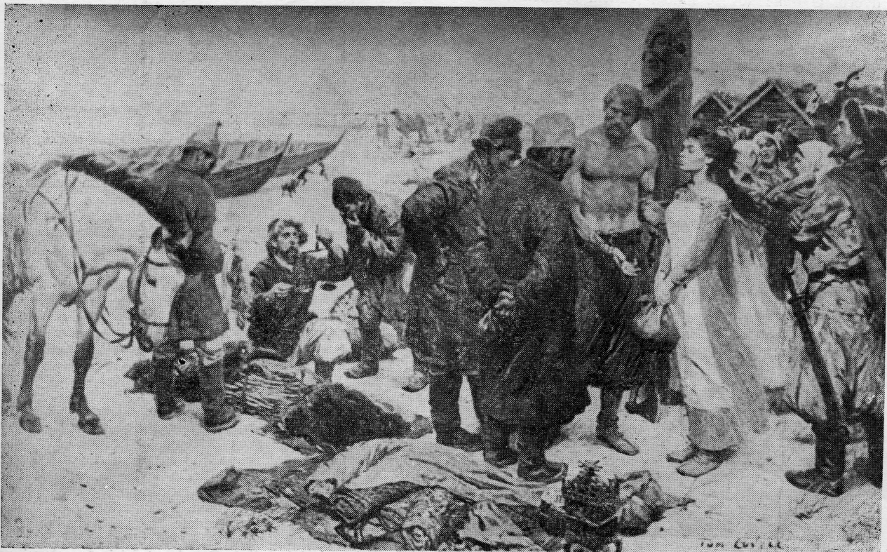
Vikinzi trguju robljem

»Prije nego je Skandinavija postala samostalna — kaže Arne Emil Christenson, upravitelj Muzeja starina u Oslu — Danci, Šveđani i Norvežani govorili su zajedničkim jezikom, dijelili istu kulturu i malo su znali o svijetu izvan svoje zemlje. Baš vrijeme koje prethodi vikinškom periodu pruža dokaze o značajnoj ekspanziji pučanstva. Međutim, zemlja nije mogla da podnese više ljudi. Tako se oni prihvatili svojih brodova i zaploviše prema bogatijim krajevima na jugu. Ovi brodovi, više od ljudi koji su na njima plovili, udariše temelje vikinškom vremenu«. Šveđani, koji krenuše svojim brodovima preko Baltika prema istoku, prodriješe u neprekledne brezove šume i stepe Rusije. Oni brzo nadvladaše tamnošnje stanovništvo pa osvojivši Novgorod, glavno trgo-