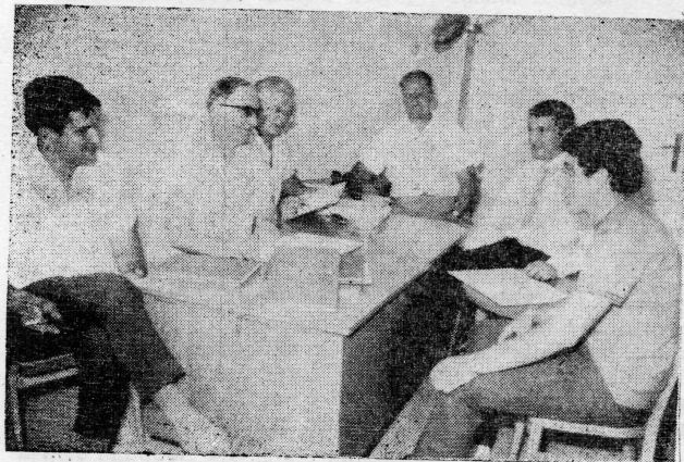
Detalj sa odbrane dva diplomska rada

Iz gornjeg prikaza se vidi da je postignut veliki uspjeh u ojačanju nastavnog kadra, pogotovo ako se ima u vidu, da je veoma teško doći do odgovarajućeg nastavnog kadra za ovu vrstu škole, jer su istoj potrebni specijalizirani stručnjaci, koji pored teoretskog znanja