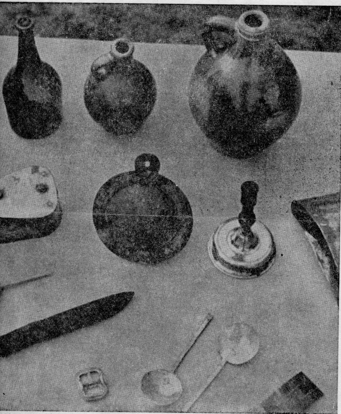
Predmeti pronađeni u utrobi broda

Nizozemska vlada mora dati odluku o subdini ukopanog broda, koji bi bio drugi slučaj po vrijednosti u pomorskoj povijesti vađenja brodova.