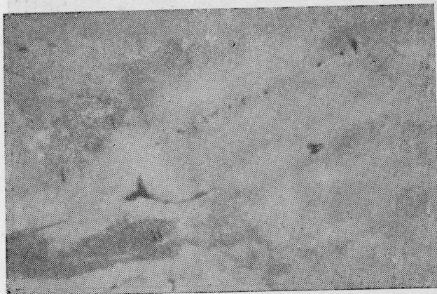
Pojedini djelovi strše iz mora (pijeska)