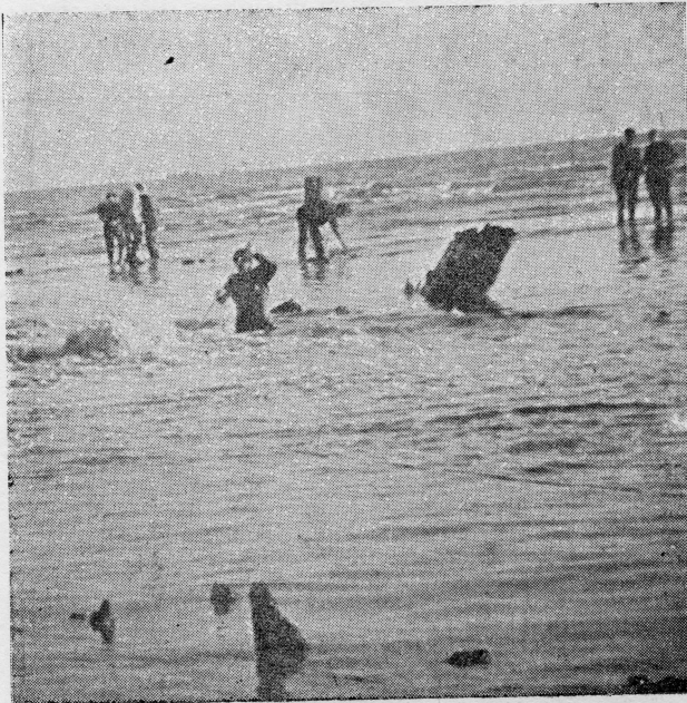
Stršća rebra »Amsterdama« prilikom prolijetne oseke

Zapovjednik Klump dao je nalog svojim ljudima da se iskrcaju sve najvrijednije stvari, što se pokazalo kao mudra odluka, jer su stanovnici mjesta kasnije pomalo pljačkali brod, pa su mjesne vlasti bile prisiljene da postave straže zbog zaštite. Ali kroz nekoliko slijedećih dana, na opće iznenađenje, brod je počeo lagano tonuti u pijesak. Promjenjive struje koje vladaju u kanalu pomicala su neopaženo pijesak oko broda, a brod je, na taj način sebi stvarao ležište i pomalo tonuo u pijesak.