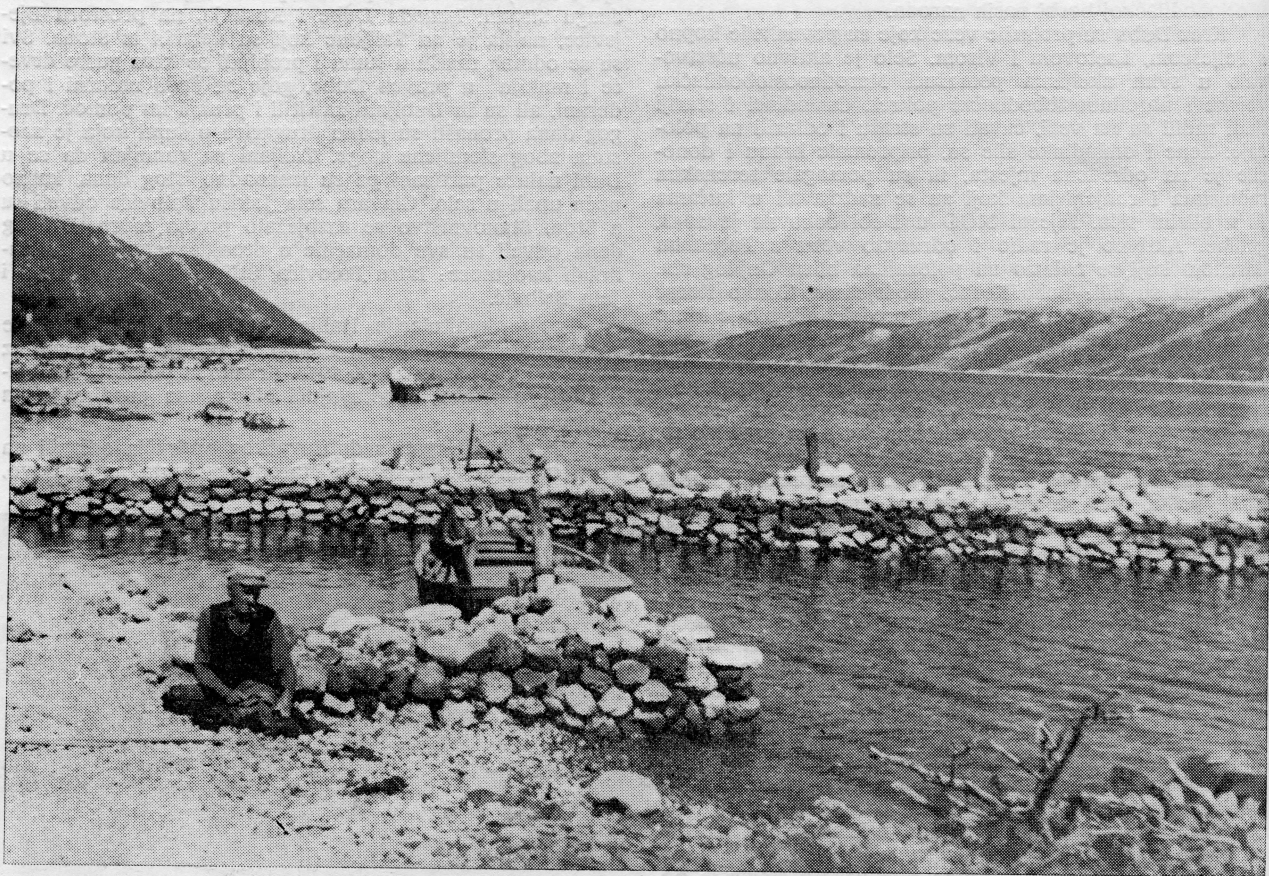
Duba kod Stona — obalni predio

Danas selo živi životom kako su bili naučeni i njihovi stariji stanovnici, samo u povoljnijim uvjetima. Električfikacija mjesta donijela je mnoge prednosti domaćinstvima. Put koji se gradi od Luke do Dube povezat će Dubu sa Stonom, a time otvoriti perspektive razvoja turizma na ovom zaista krasnom obalnom području. To će Dubljanima omogućiti bolje uvjete rada i života.