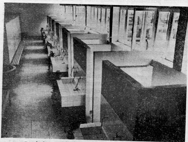
Pogled na svlačionice jedne radne jedinice

Pored solidnih priprema i uloženog truda organizatora, ipak je izostala očekivana masovnost. Izuzetak su i ovoga puta bravari. Sala je bila dupkom puna, a prisustvovali su i nečlanovi . . .