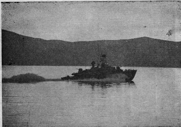
Torpedni čamac — povratak u bazu