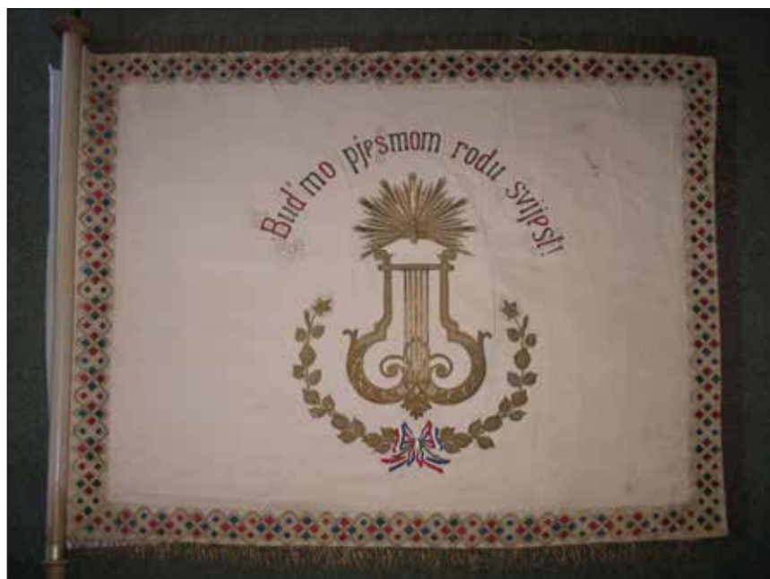
Slika 10.1 i 10.2. Zastava HPD Davor – današnji izgled