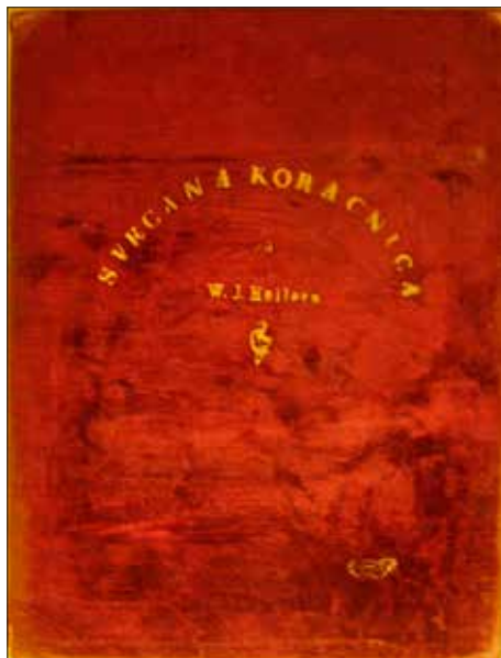
Slika 5. Koračnica kumi zastave Ivani Brlić Mažuranić (korice). Komponirao Vinkof Heller, kapelnik 29. pukovnije u Brodu na Savi (Arhiv obitelji Brlić, k. 118, sv. 6.)