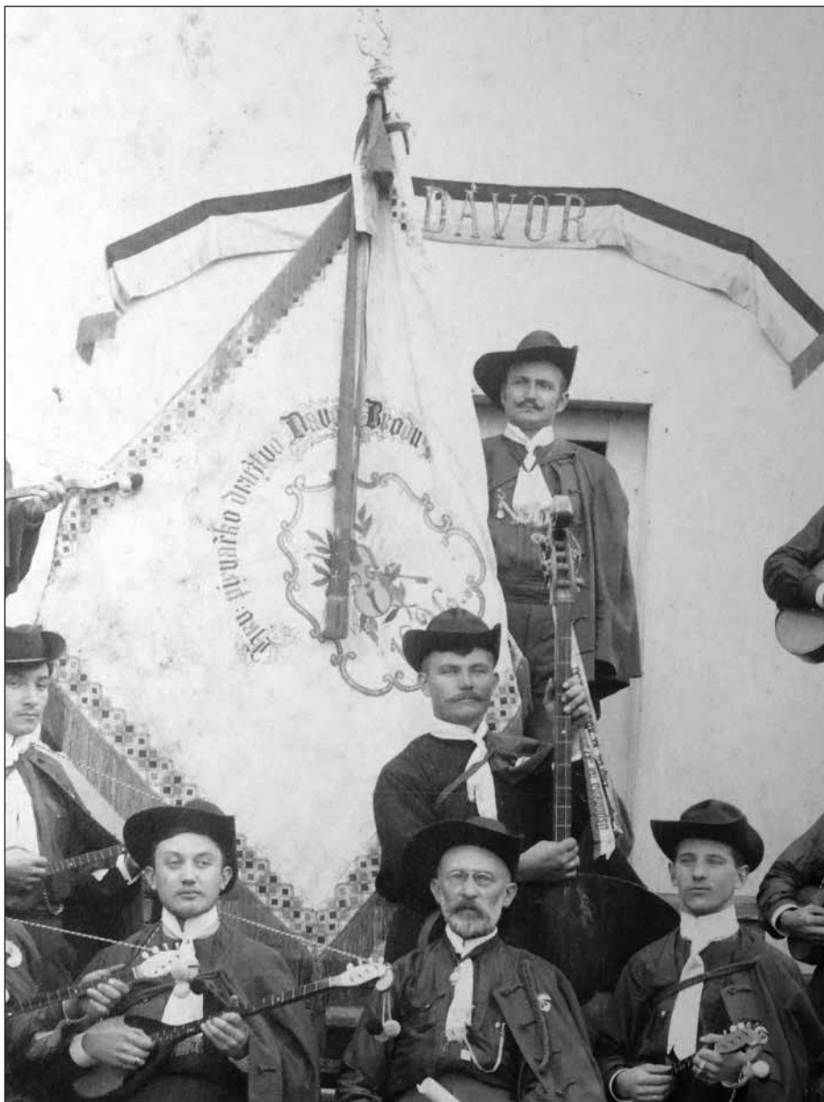
Slika 9. S proslave 35. godišnjice Davora 1906. godine. Zastava iz 1896. (AOB, k. 118, sv. 6.)