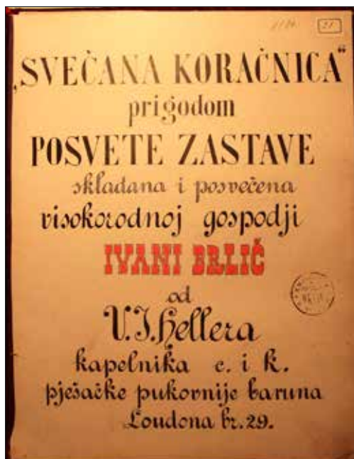
Slike 6.1 – 6.7. Koračnica kumi zastave Ivani Brlić Mažuranić – naslovna stranica (Arhiv obitelji Brlić, k. 118, sv. 6.) Slijede stranice 3.-8. u Koračnici.