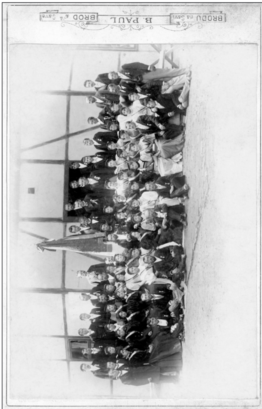
Slika 2. Hrvatsko pjevačko društvo „Davor“ prigodom posvete zastave 1896.