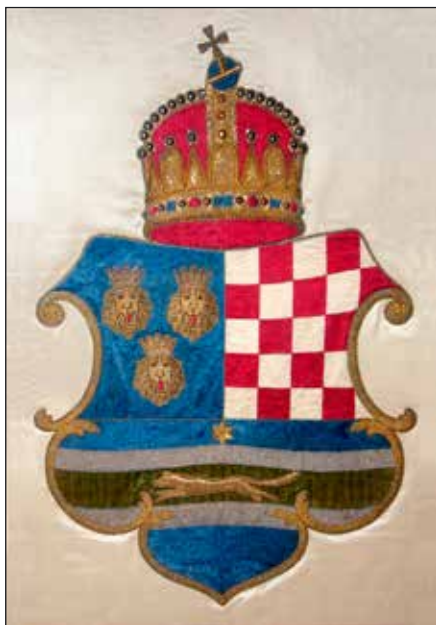
Slika 8. Grb na zastavi „Davora“, skinut po nalogu banske Vlade 1896.