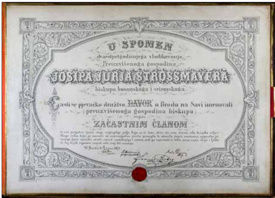
Slika 7. Josip Juraj Strossmayer počasni član Hrvatskoga pjevačkog društva „Davor“